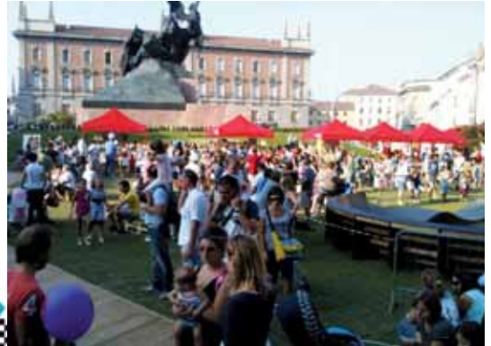
Un'immagine di Piazza Trento e Trieste durante la prima edizione di MonzaGP