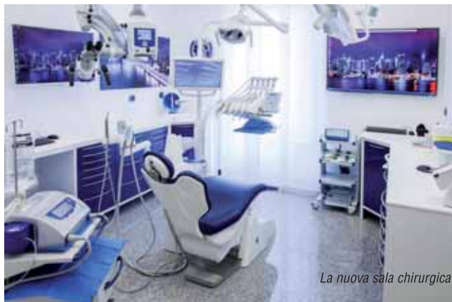
La nuova sala chirurgica