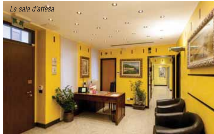
La sala d'attesa

Laurea in Medicina e Chirurgia (Università di Milano) Specialista in Chirurgia Plastica Ricostruttiva ed Estetica (Università di Udine) Membro SICPRE (Società Italiana di Chirurgia Plastica, Ricostruttiva ed Estetica) Membro AICPE (Associazione Italiana di Chirurgia Plastica ed Estetica)