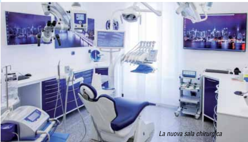
La nuova sala chirurgica