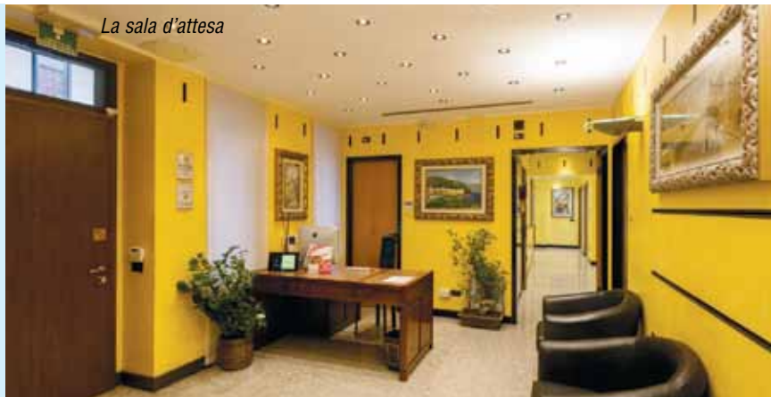
La sala d'attesa

Laurea in Medicina e Chirurgia (Università di Milano) Specialista in Chirurgia Plastica Ricostruttiva ed Estetica (Università di Udine) Membro SICPRE (Società Italiana di Chirurgia Plastica, Ricostruttiva ed Estetica) Membro AICPE (Associazione Italiana di Chirurgia Plastica ed Estetica)