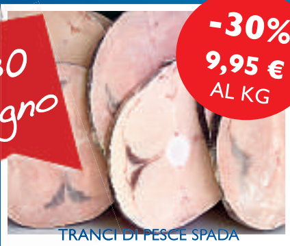
TRANCI DI PESCE SPADA