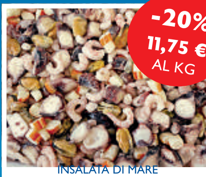
INSALATA DI MARE