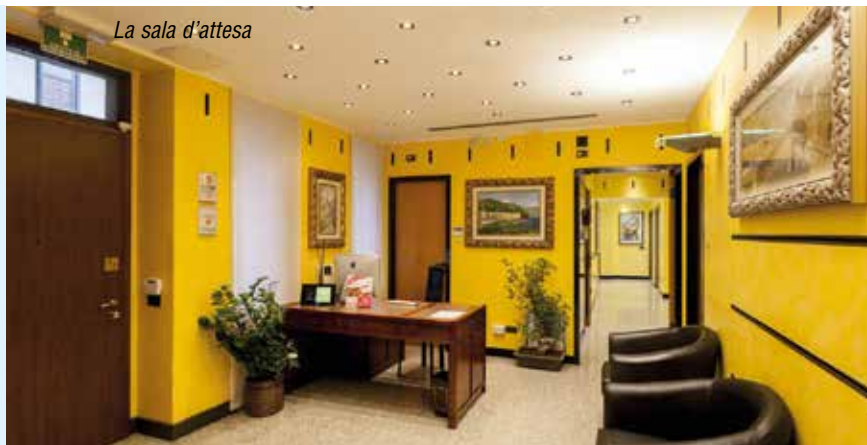
La sala d'attesa