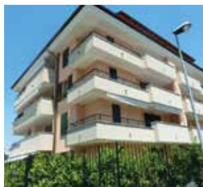
TRILOCALI E MONOLOCALI Residenza Tevere

via Marelli 52 San Fruttuoso, Monza (MB)