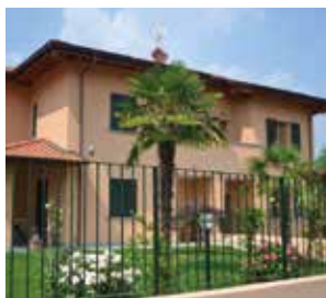
VILLETTE BIFAMILIARI Residenza Marelli Green

via Marelli 52 San Fruttuoso, Monza (MB)