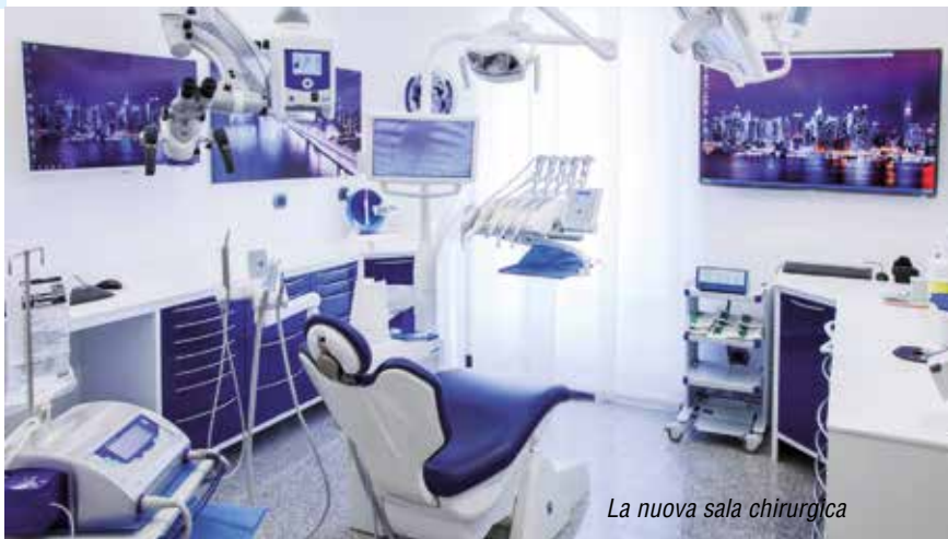
La nuova sala chirurgica