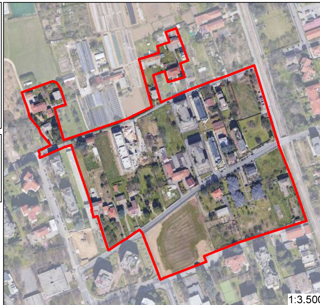
AIP Gondar su foto aerea