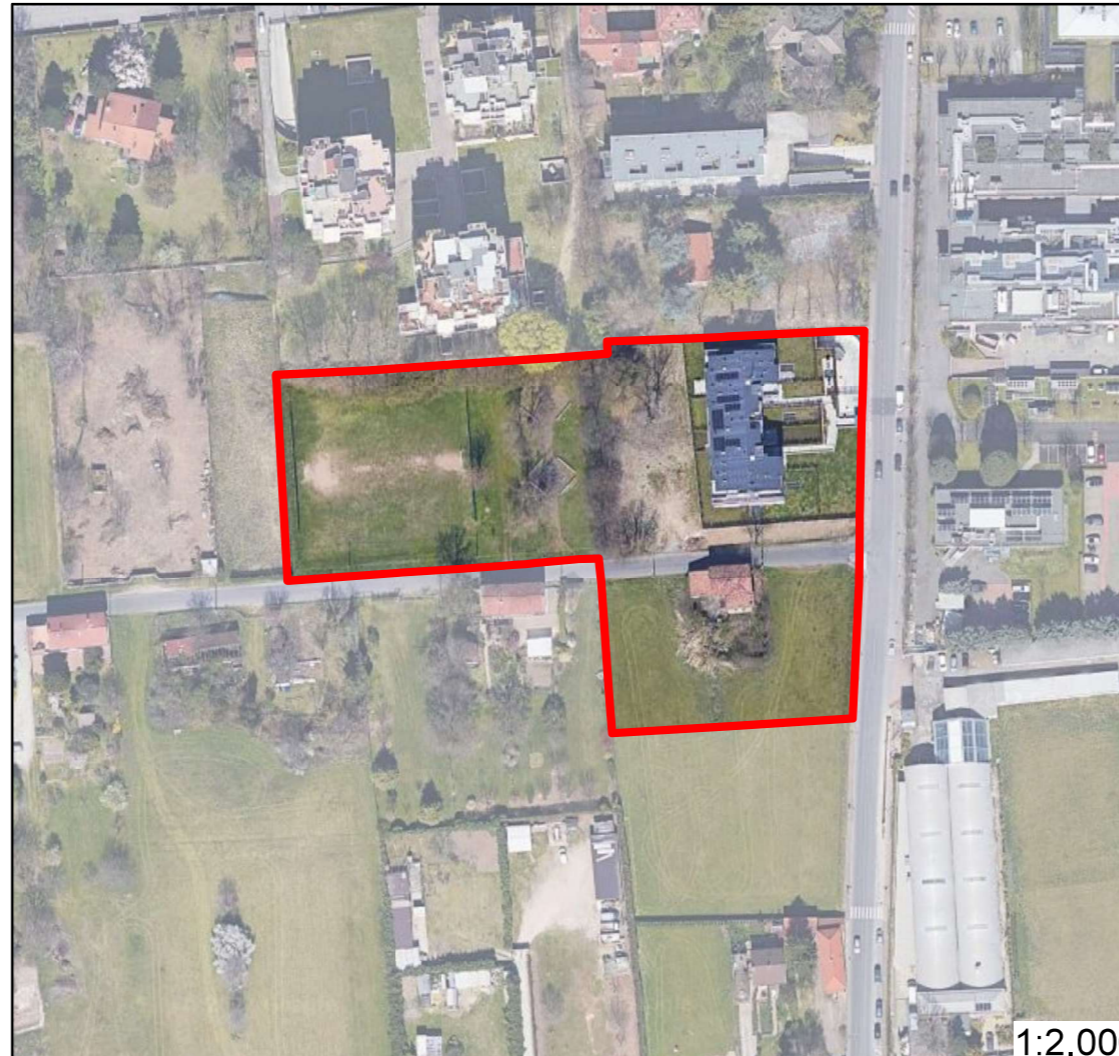
AIP Valosa su foto aerea