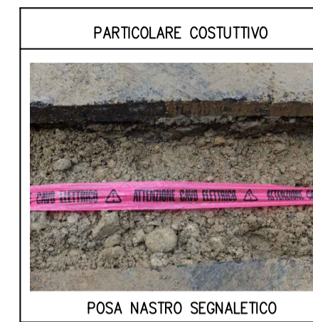
POSA NASTRO SEGNALETICO

L'IMPIANTO SARÀ REALIZZATO IN CLASSE 2 NEL RISPETTO DELLA NORMATIVA VIGENTE DEGLI IMPIANTI DI ILLUMINAZIONE PUBBLICA.