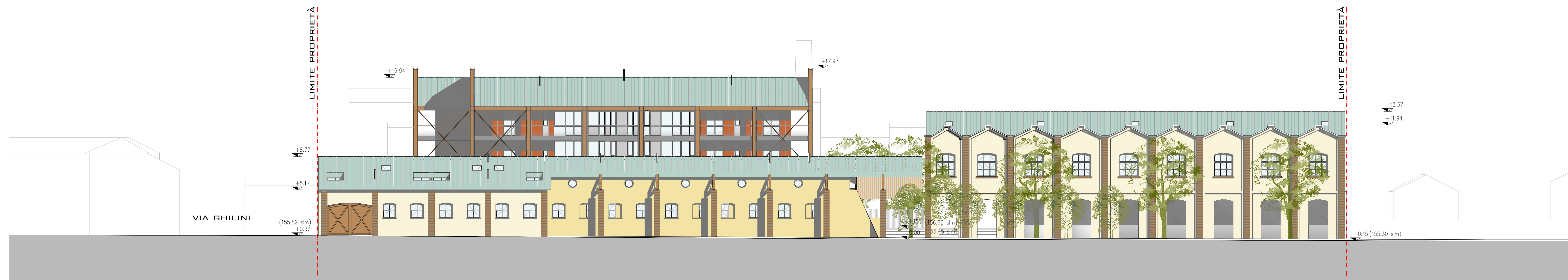
SEZIONE URBANA AA SULLA VIA GHILINI - SCALA 1:200