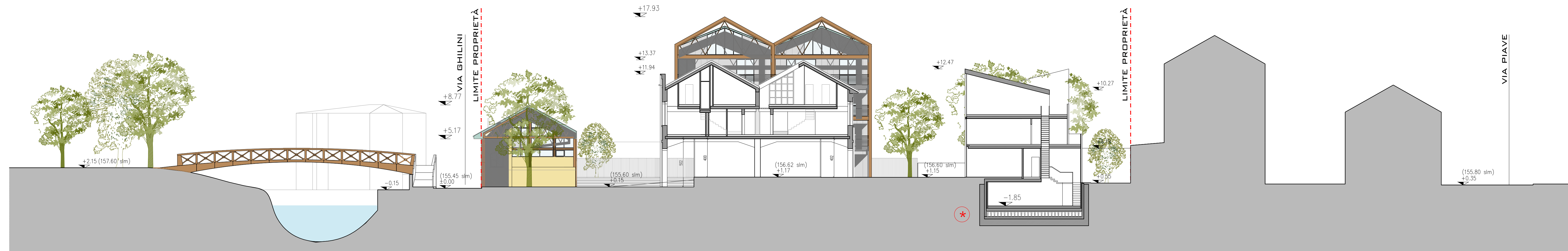
SEZIONE URBANA BB - SCALA 1:200