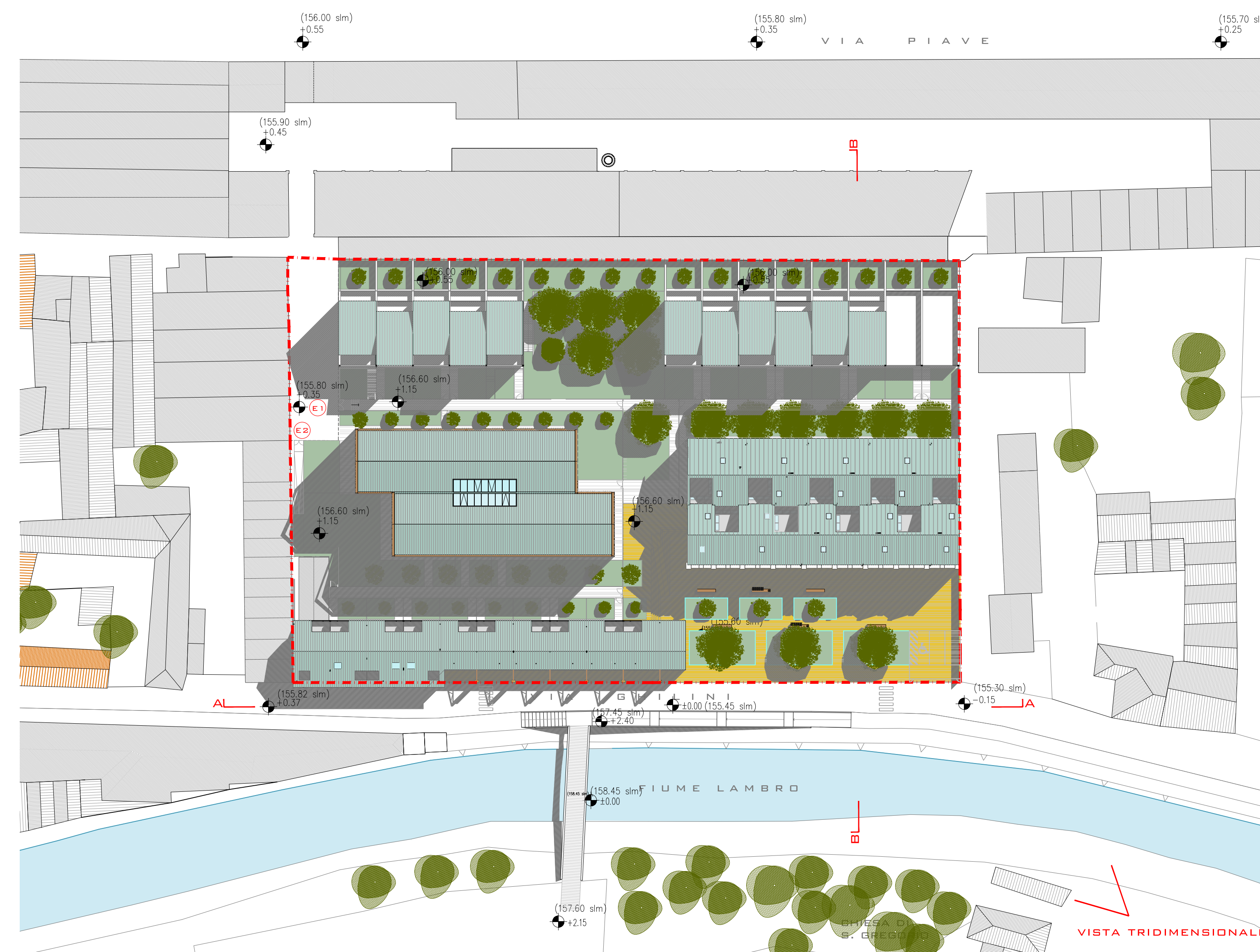
PLANIMETRIA GENERALE DELLE COPERTURE - SCALA 1:500