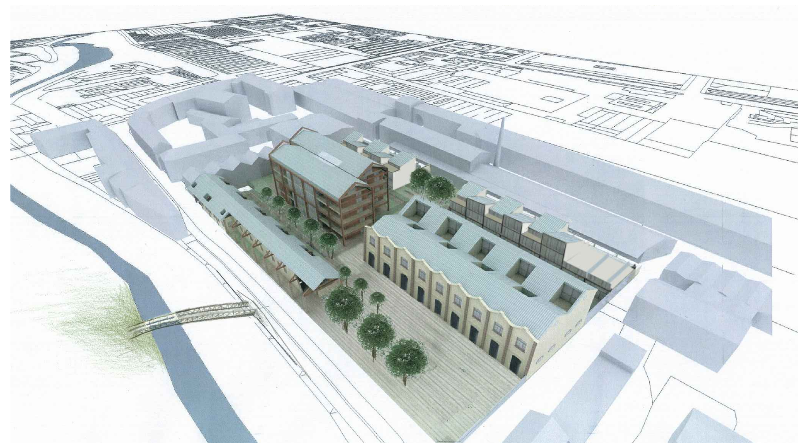
VISTA AEREA DA SUD-OVEST DEL TRIDIMENSIONALE DI PROGETTO

(CON RIFERIMENTO ALL'ELABORATO DEL PII M4-PROPOSTE PROGETTUALI)