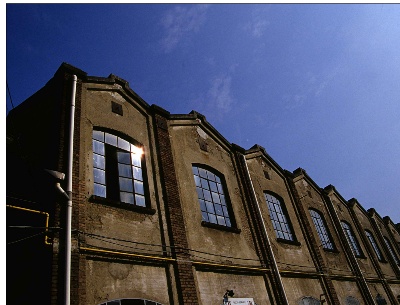
VISTA 6 EDIFICIO MULTIPIANO (CORPO B) IDENTIFICATO QUALE ARCHEOLOGIA INDUSTRIALE NELL'AREA 9A DEL DOCUMENTO DI INQUADRAMENTO VISTE DEL FRONTE OVEST