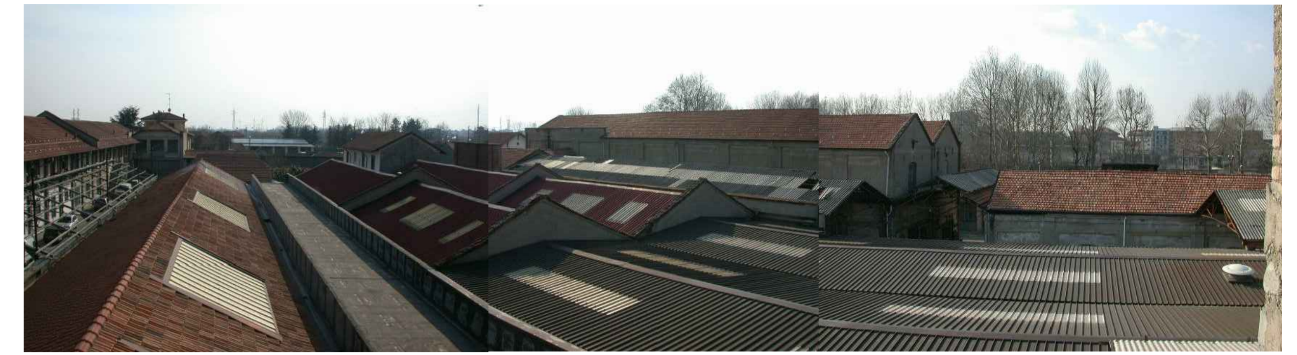
VISTA 1 AEREA DELLE COPERTURE DA NORD EST