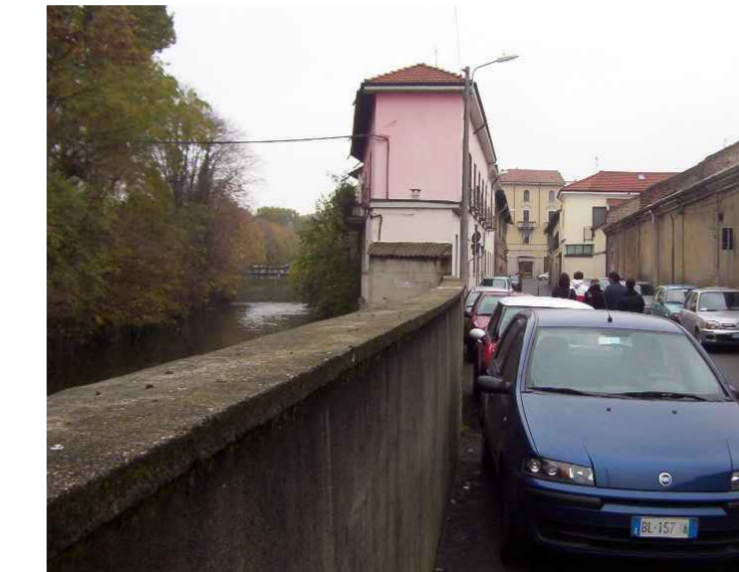
VISTA 2 VISTE DEL FRONTE LAMBRO DA VIA GHILINI