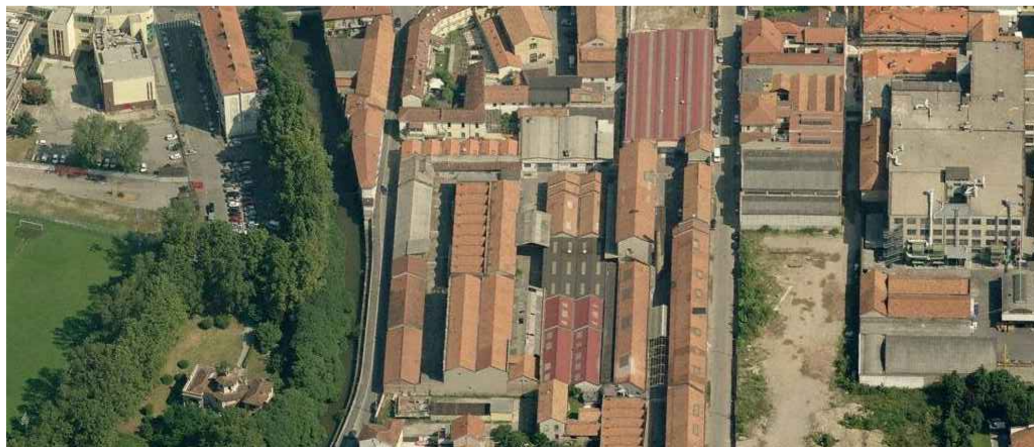
VISTA AEREA DA SUD