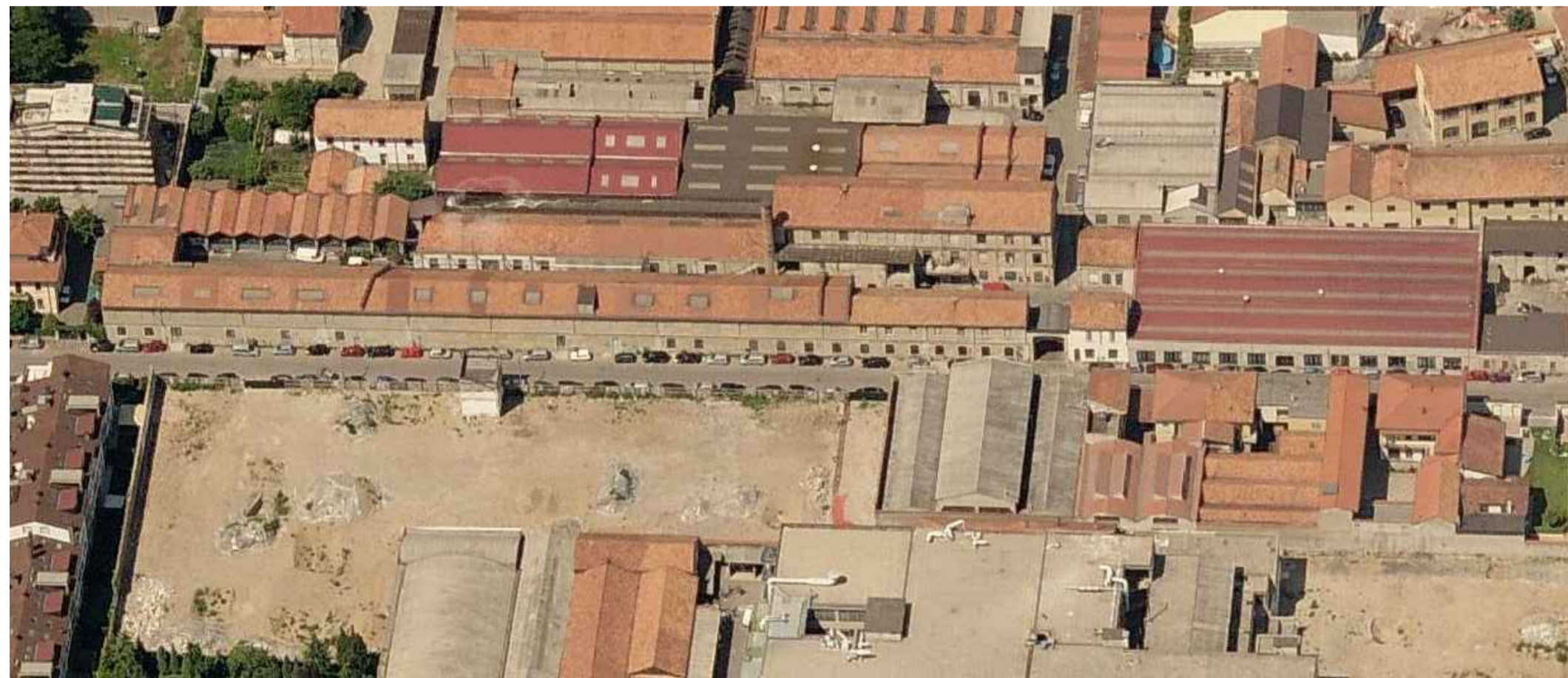
VISTA AEREA DA EST