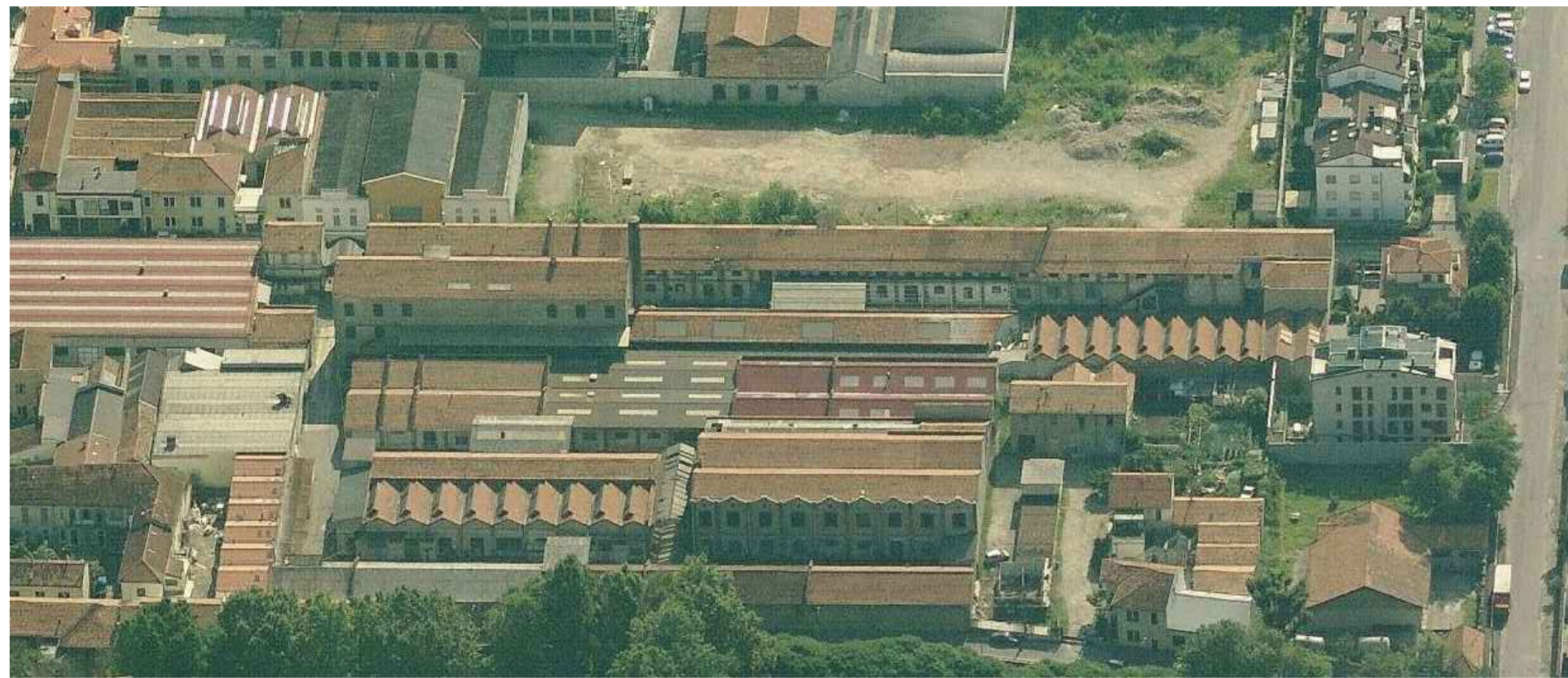
VISTA AEREA DA OVEST