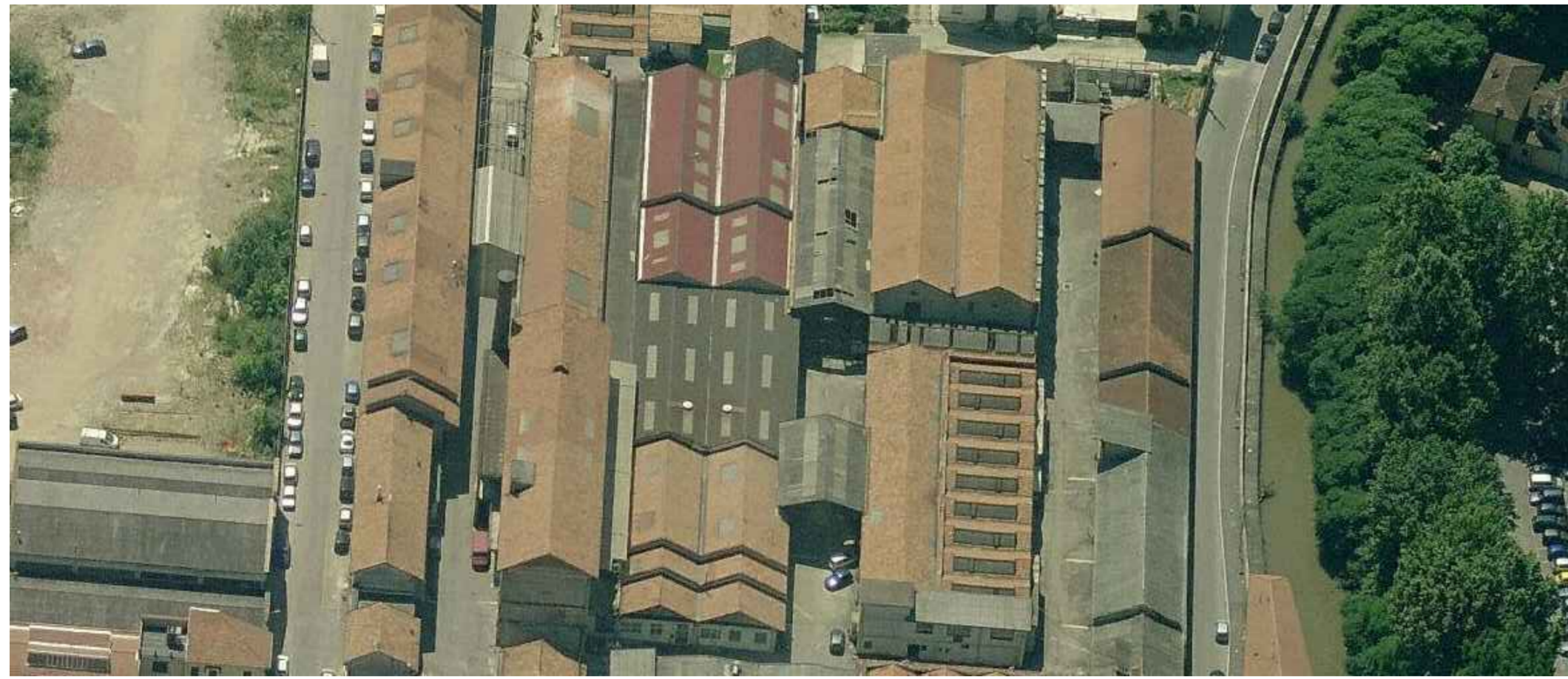
VISTA AEREA DA NORD