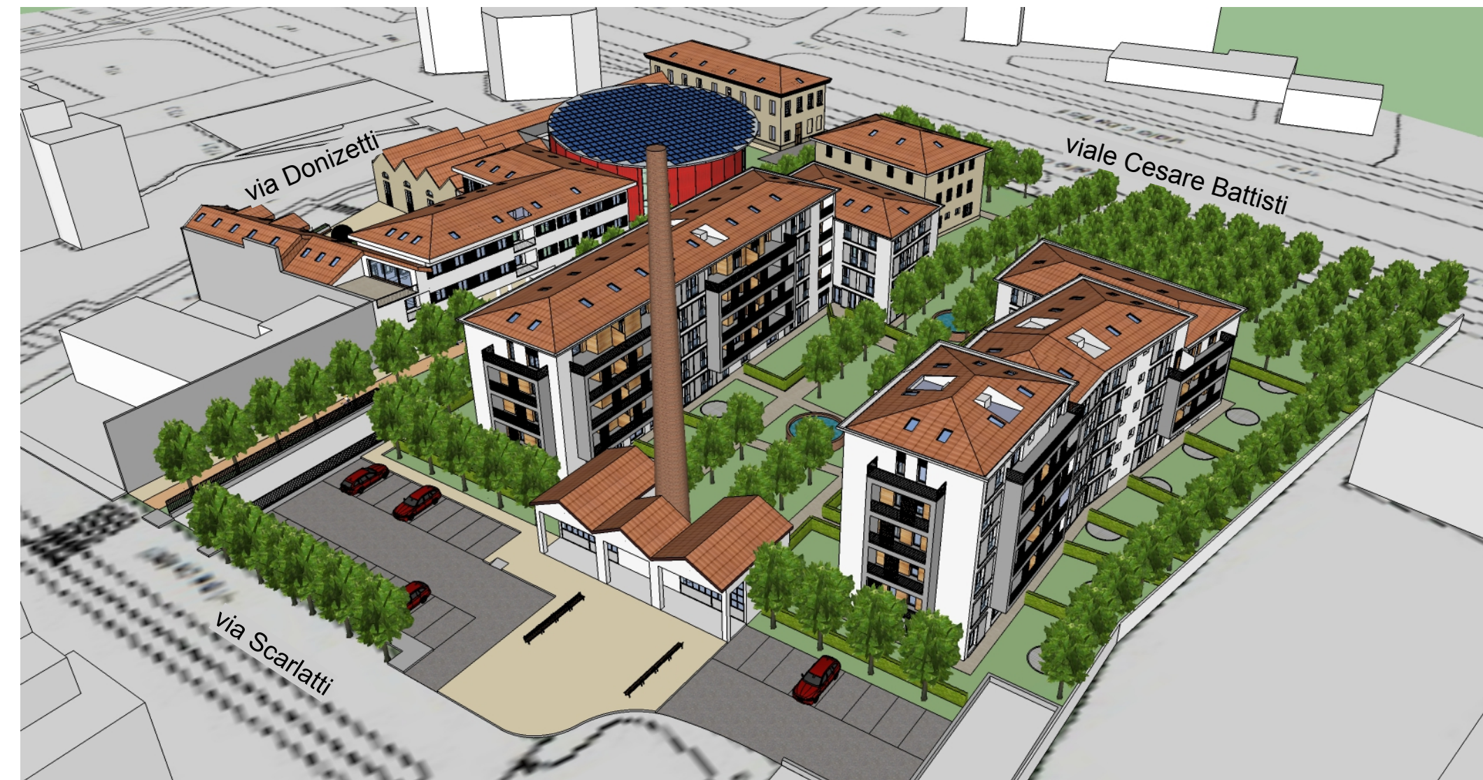
Vista 3D da via Scarlatti