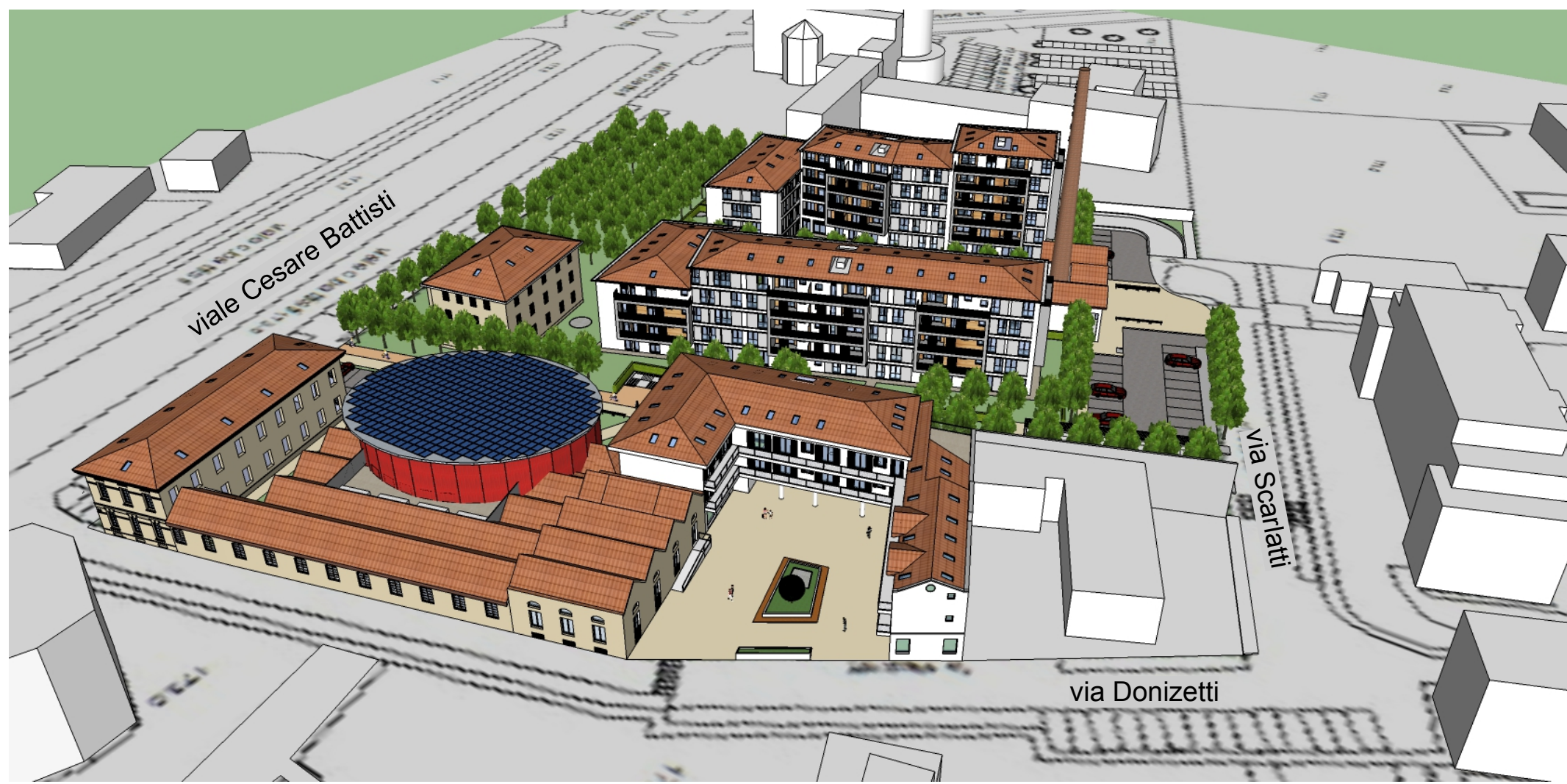
Vista 3D da via Donizetti ang. via Scarlatti