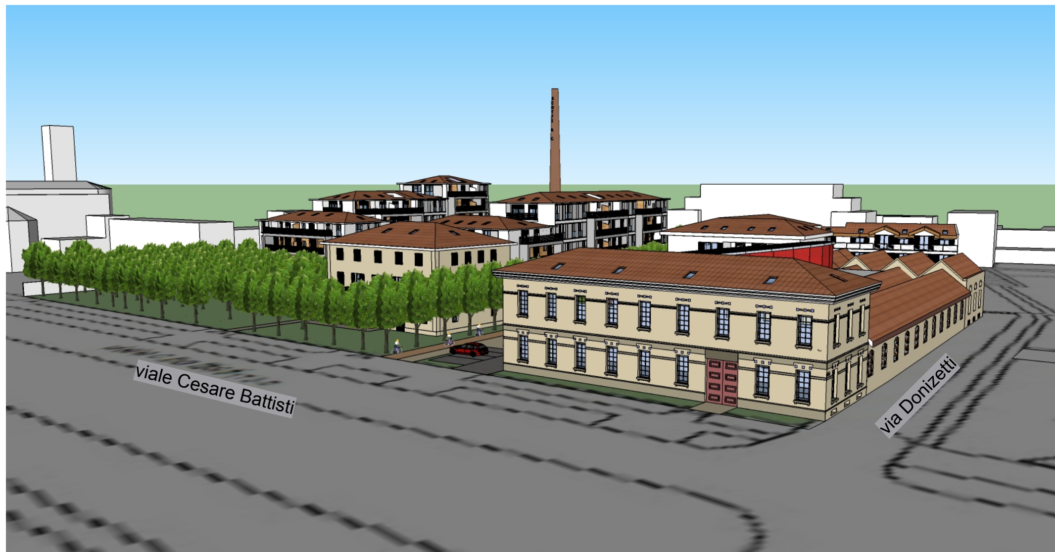
Vista 3D da viale Cesare Battisti ang. via Donizetti