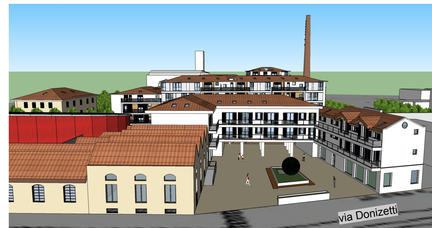
Particolare Piazza "Scotti" da via Donizetti