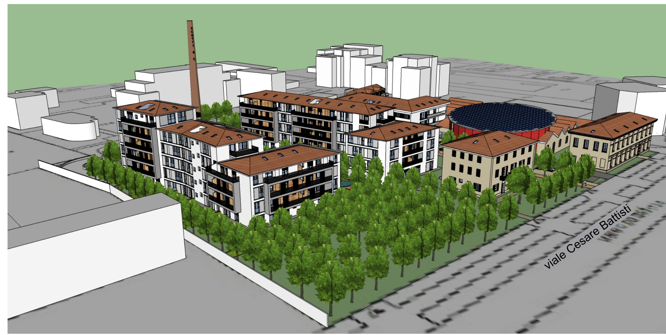
Vista 3D da viale Cesare Battisti