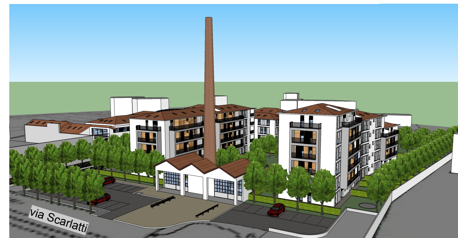
Particolare piazzetta della ciminiera da via Scarlatti