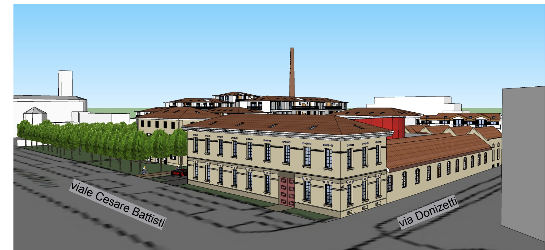
Particolare edificio B - casa della musica