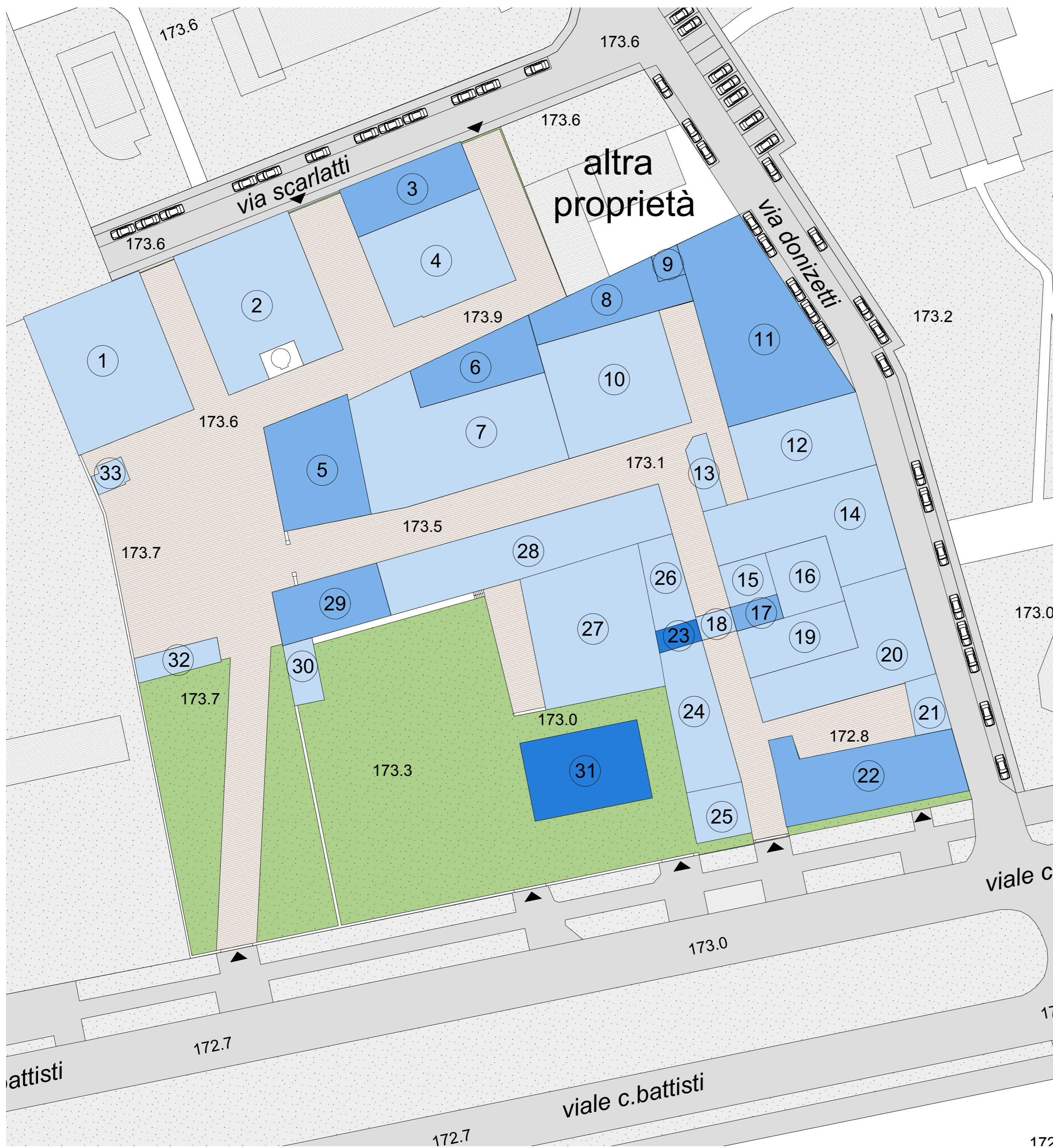
Planimetria generale scala 1:500