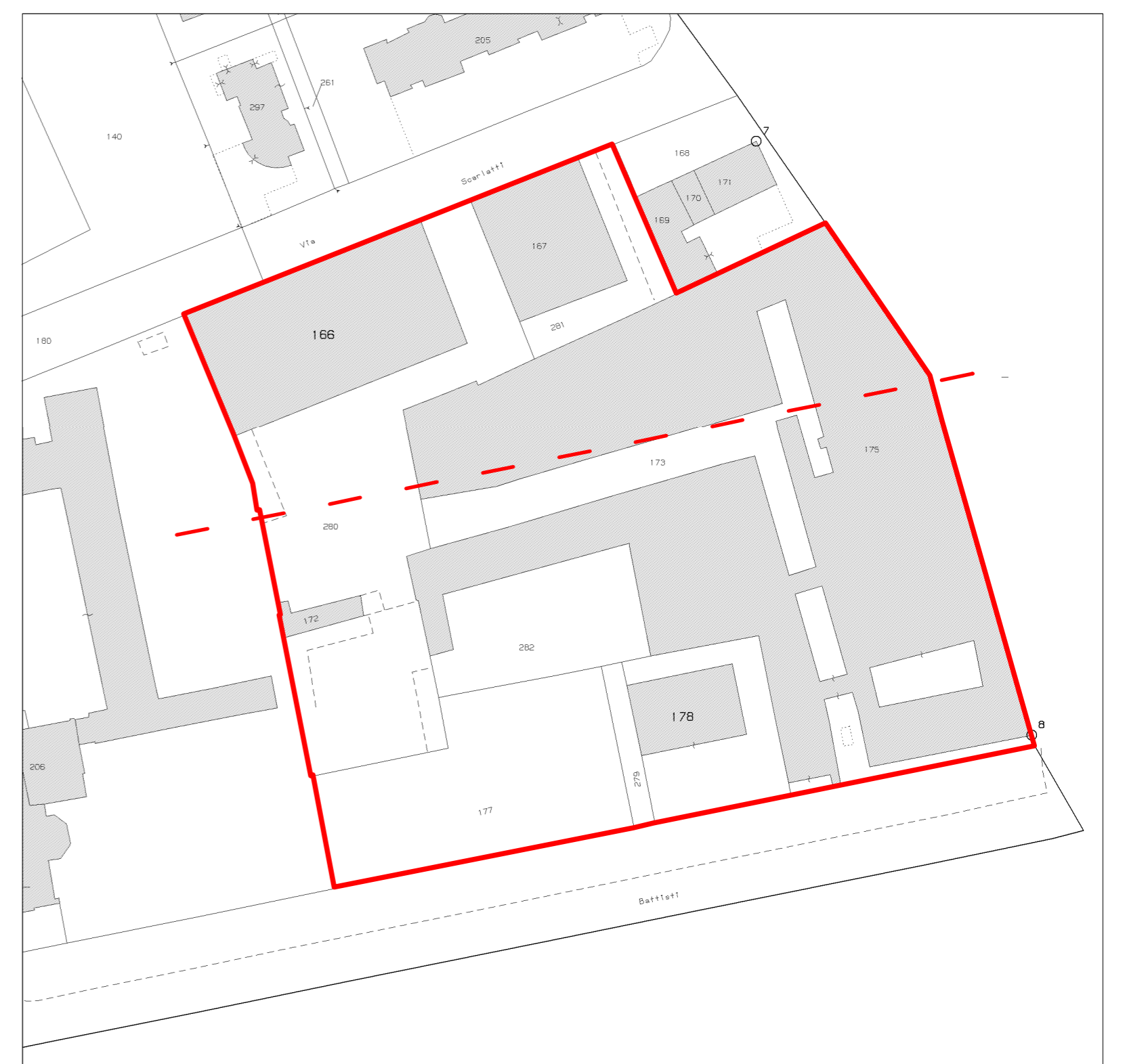
Estratto mappa fg. 19 scala 1:1000