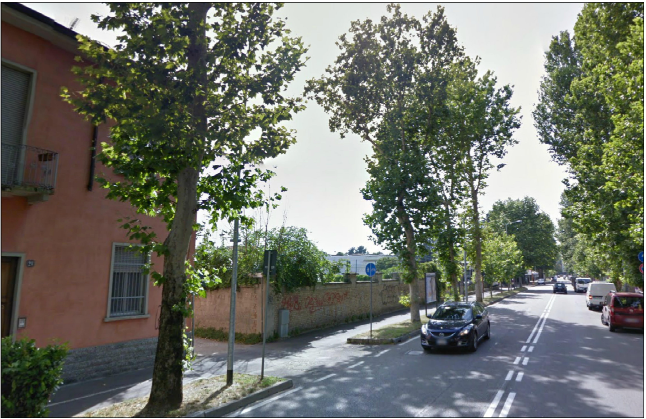
PUNTO DI VISTA n° 8