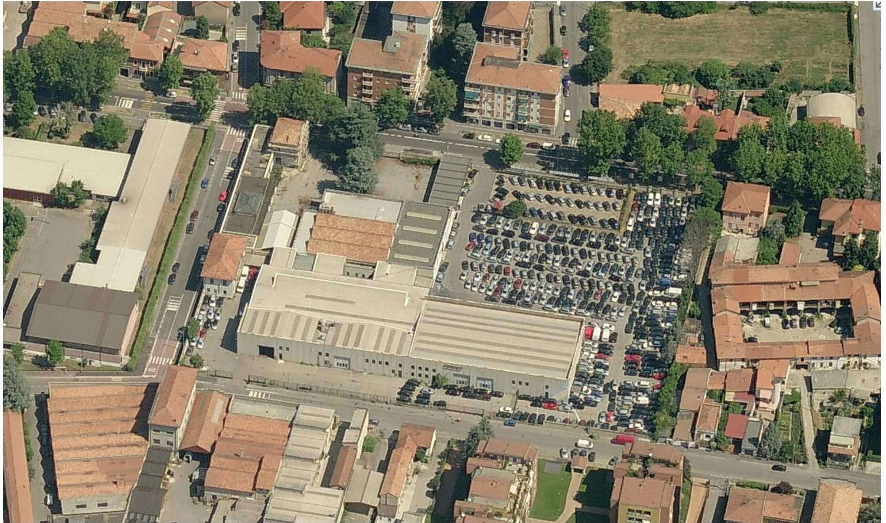
VISTA AEREA DA SUD