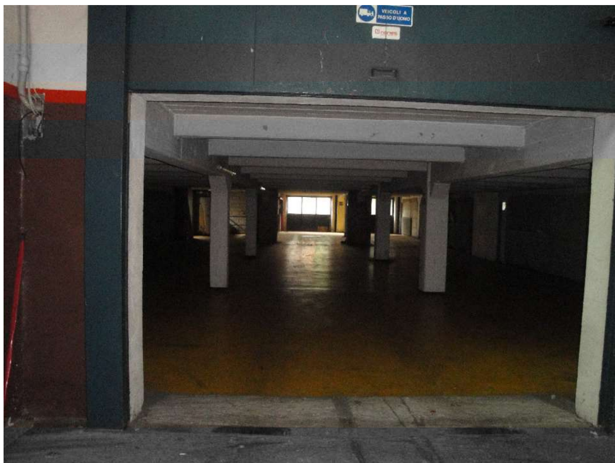
PUNTO DI VISTA 7