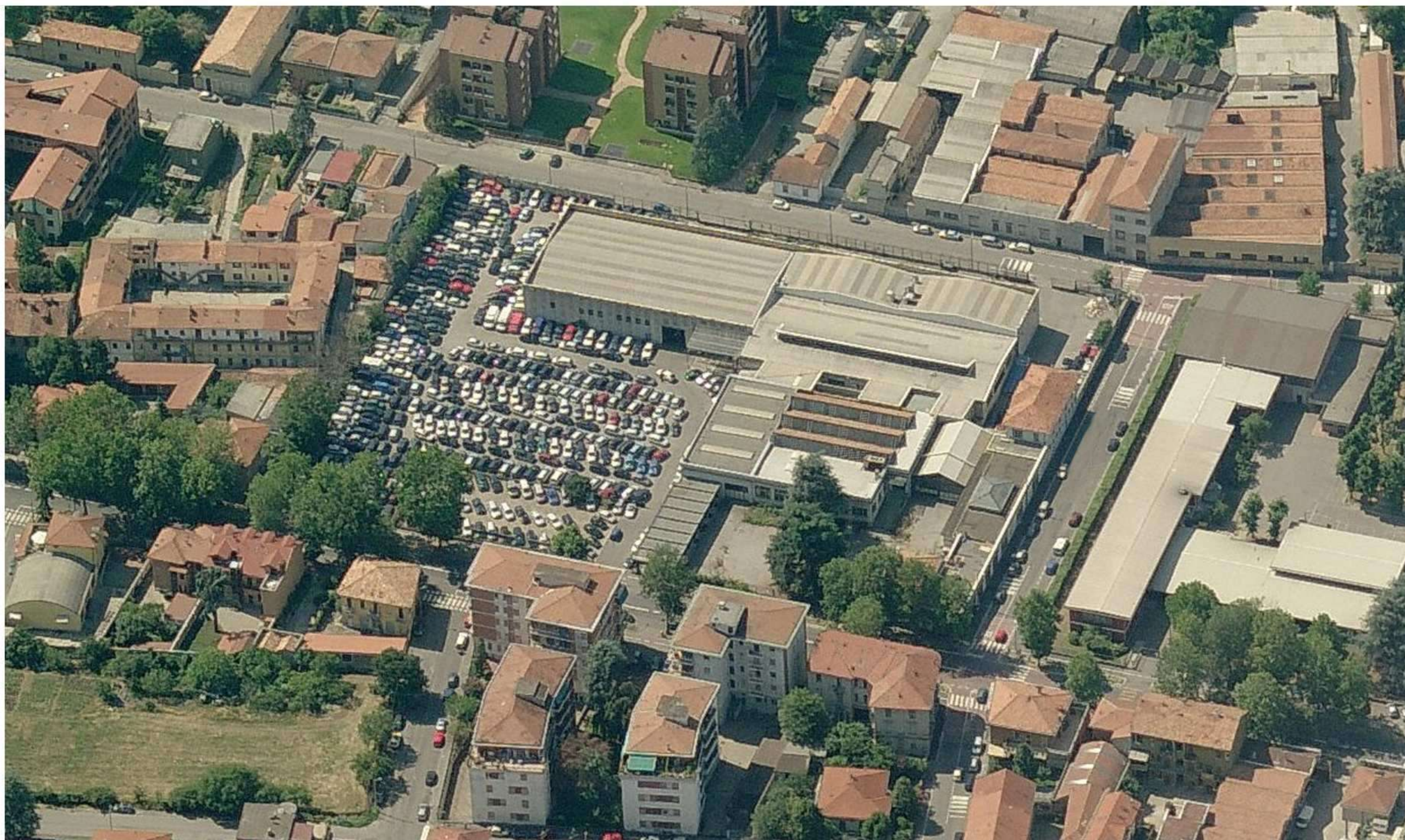
VISTA AEREA DA NORD