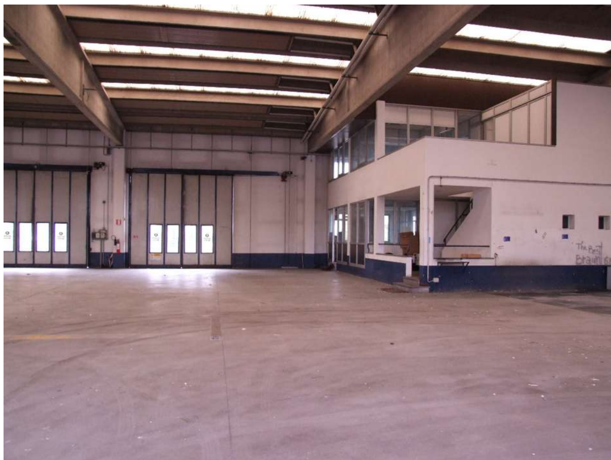
PUNTO DI VISTA 3