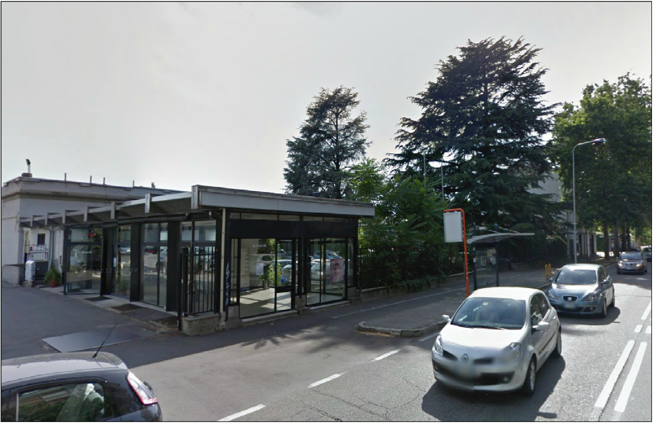
PUNTO DI VISTA n° 10