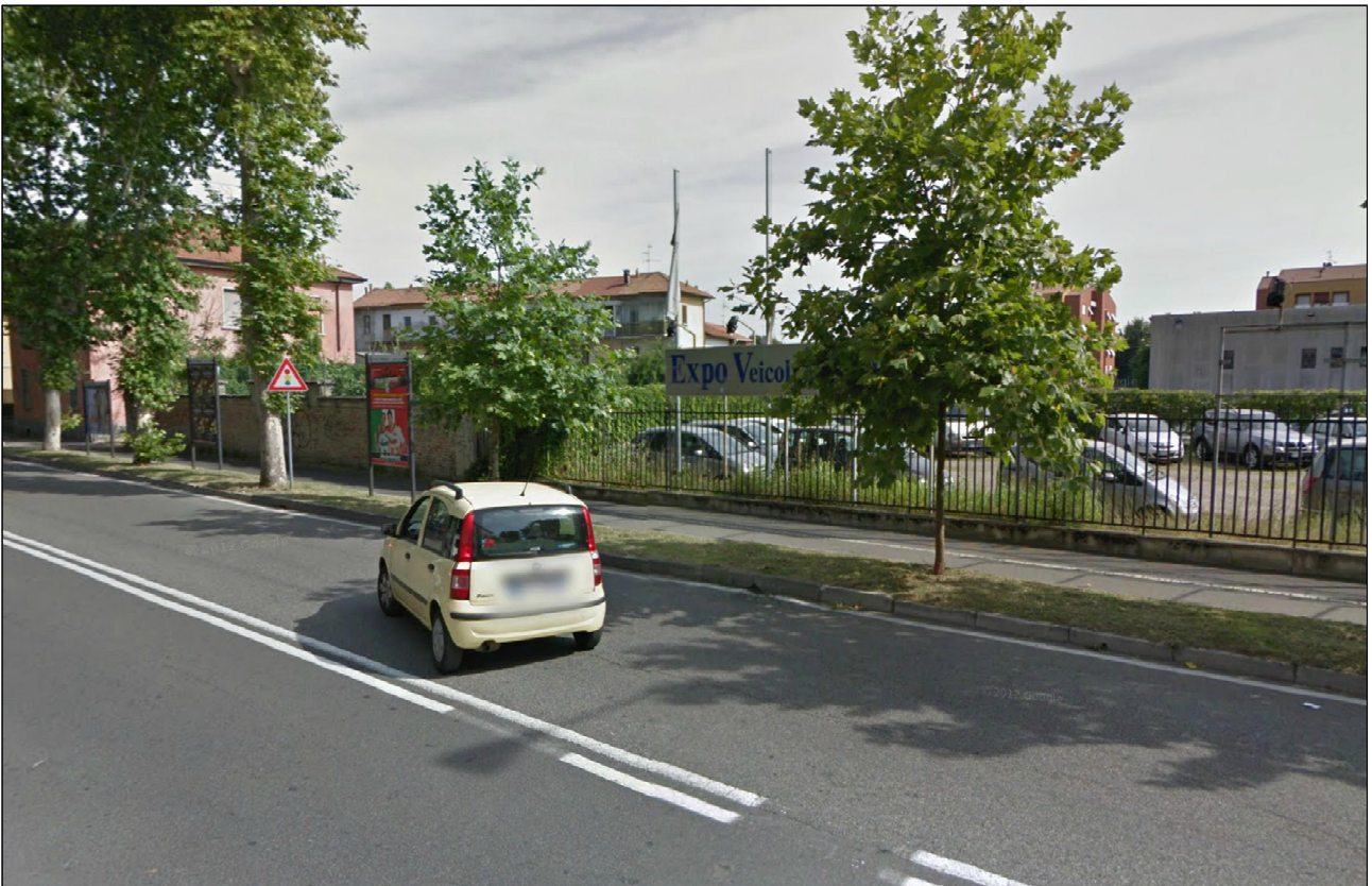
PUNTO DI VISTA n° 9