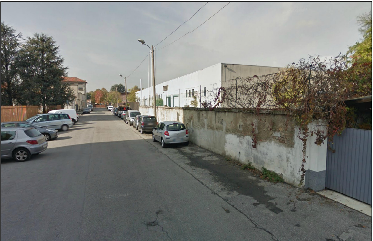
PUNTO DI VISTA n° 13