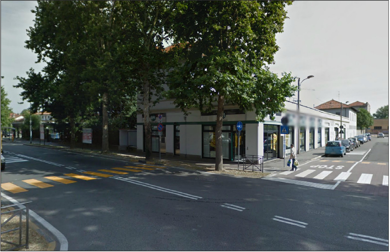
PUNTO DI VISTA n° 11