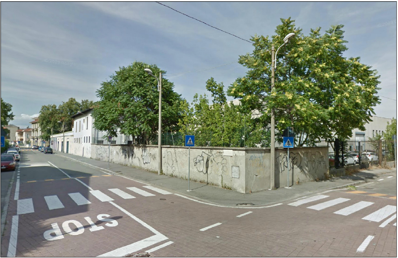
PUNTO DI VISTA n° 12