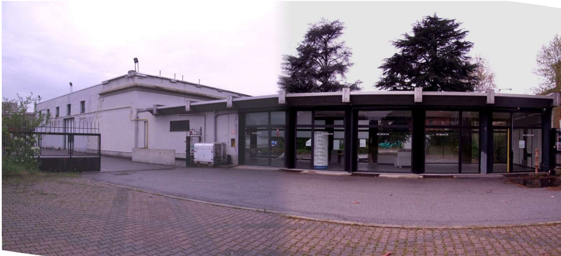
PROSPETTO INTERNO 1