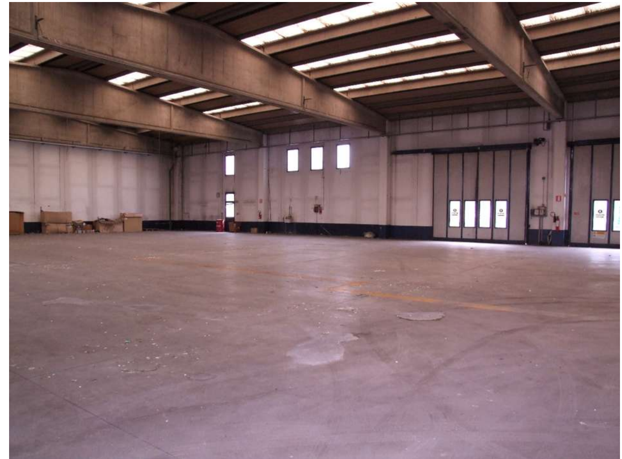
PUNTO DI VISTA 2