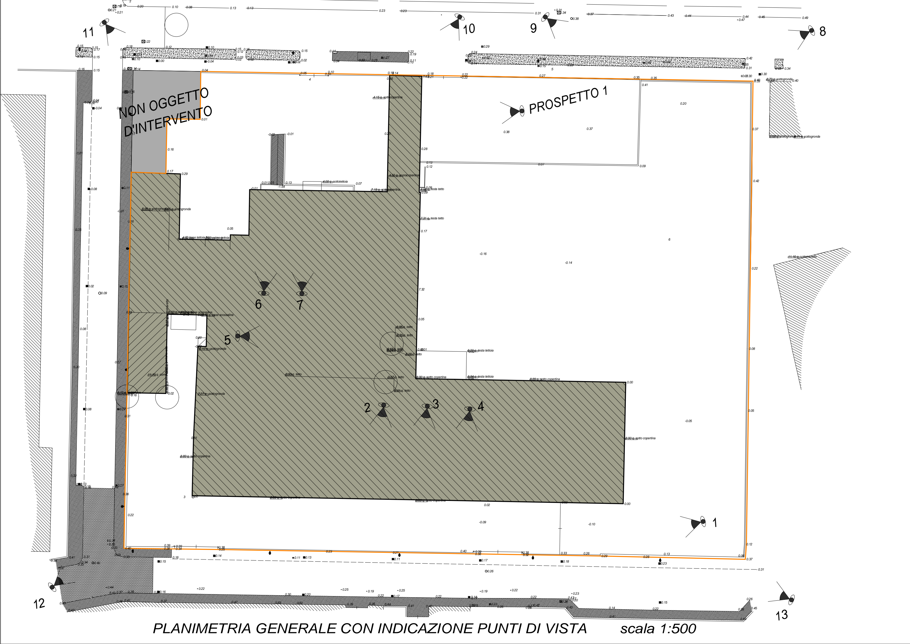
PLANIMETRIA GENERALE CON INDICAZIONE PUNTI DI VISTA scala 1:500