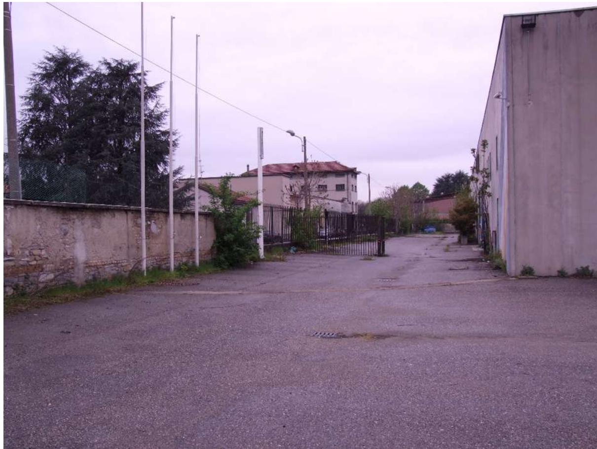
PUNTO DI VISTA 1