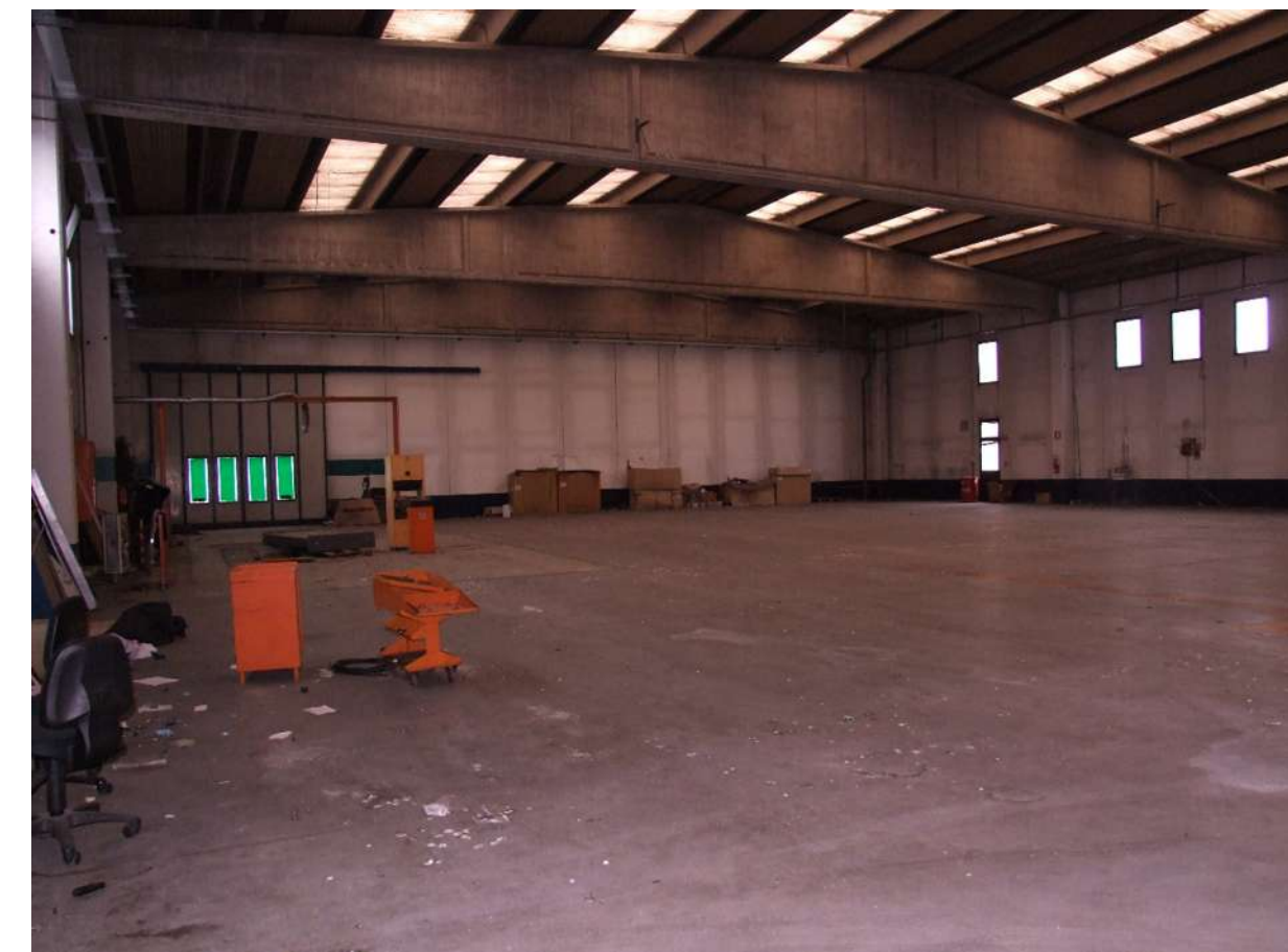
PUNTO DI VISTA 4