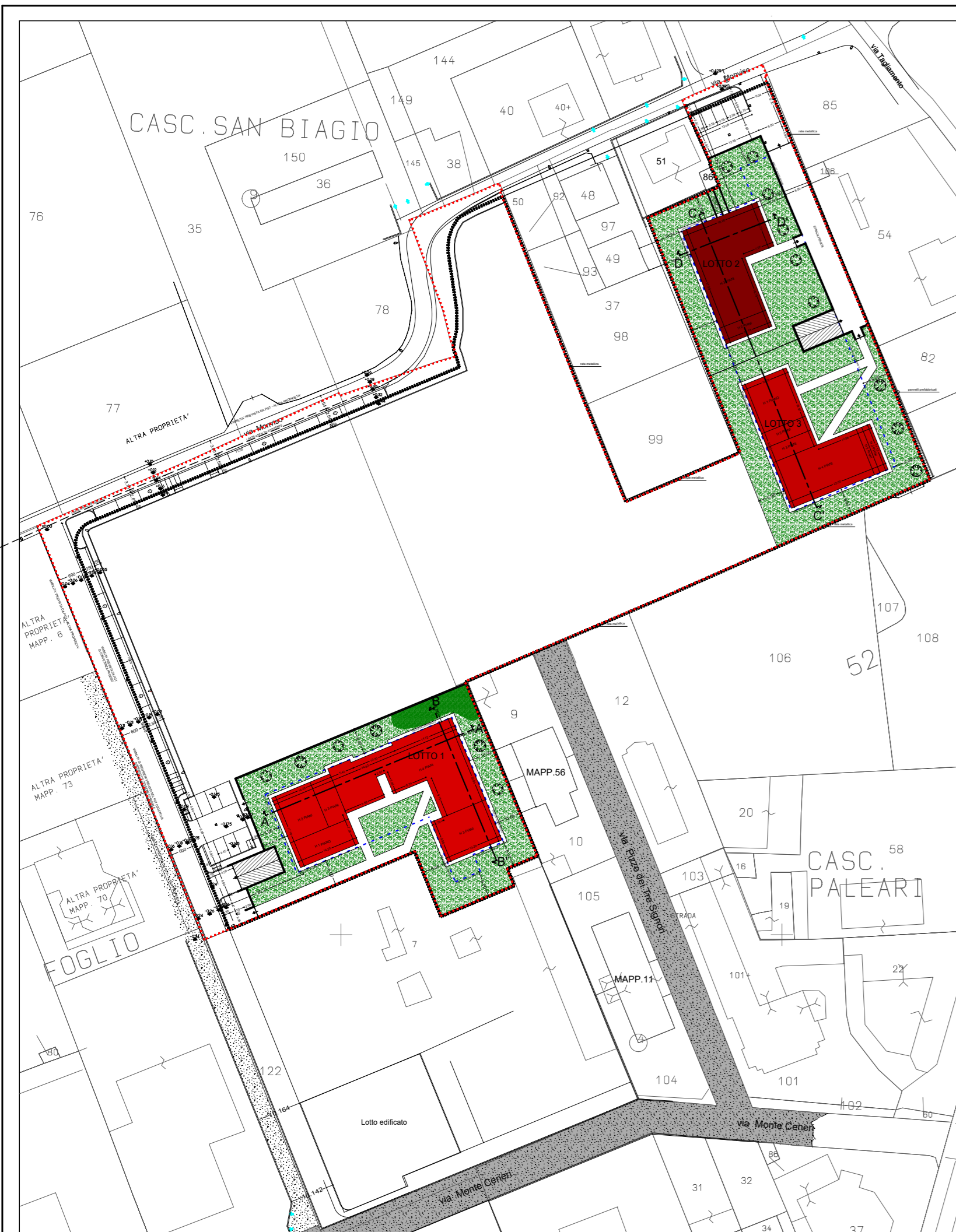
PLANIMETRIA GENERALE - SCALA 1:1000