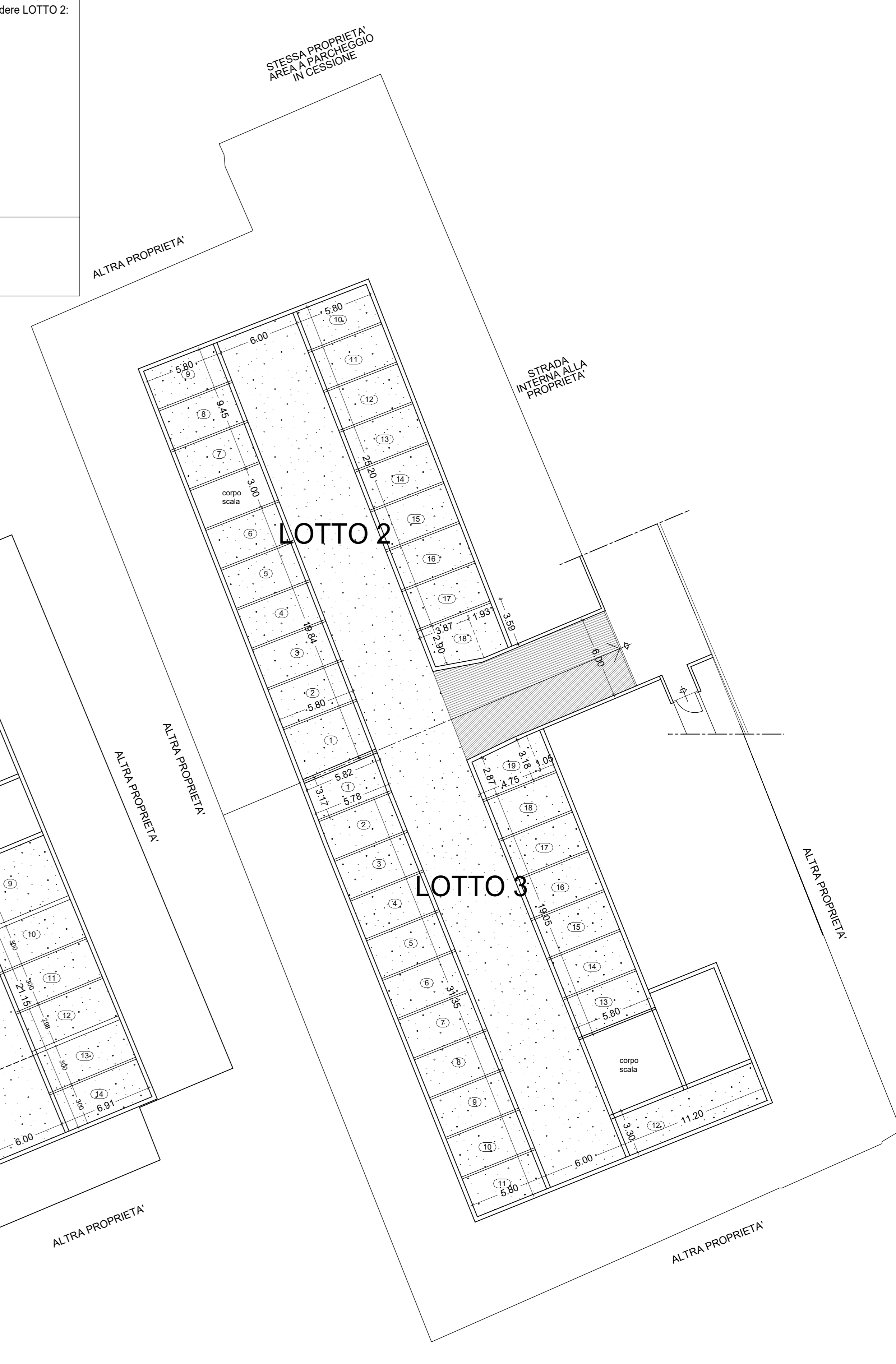
PIANO INTERRATO LOTTO 2 E LOTTO 3 - SCALA 1:200