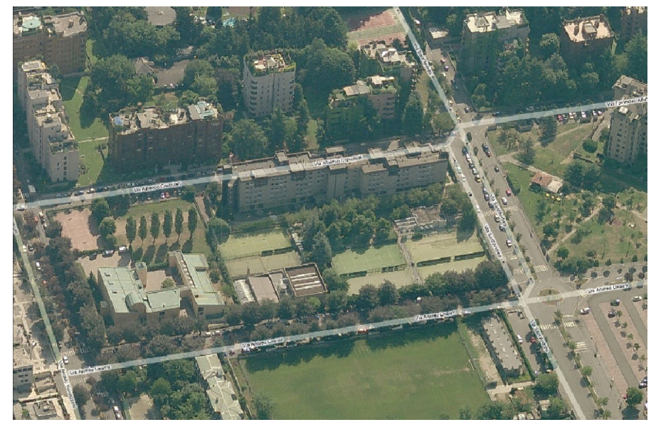
vista aerea da ovest