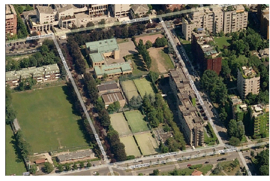
vista aerea da sud