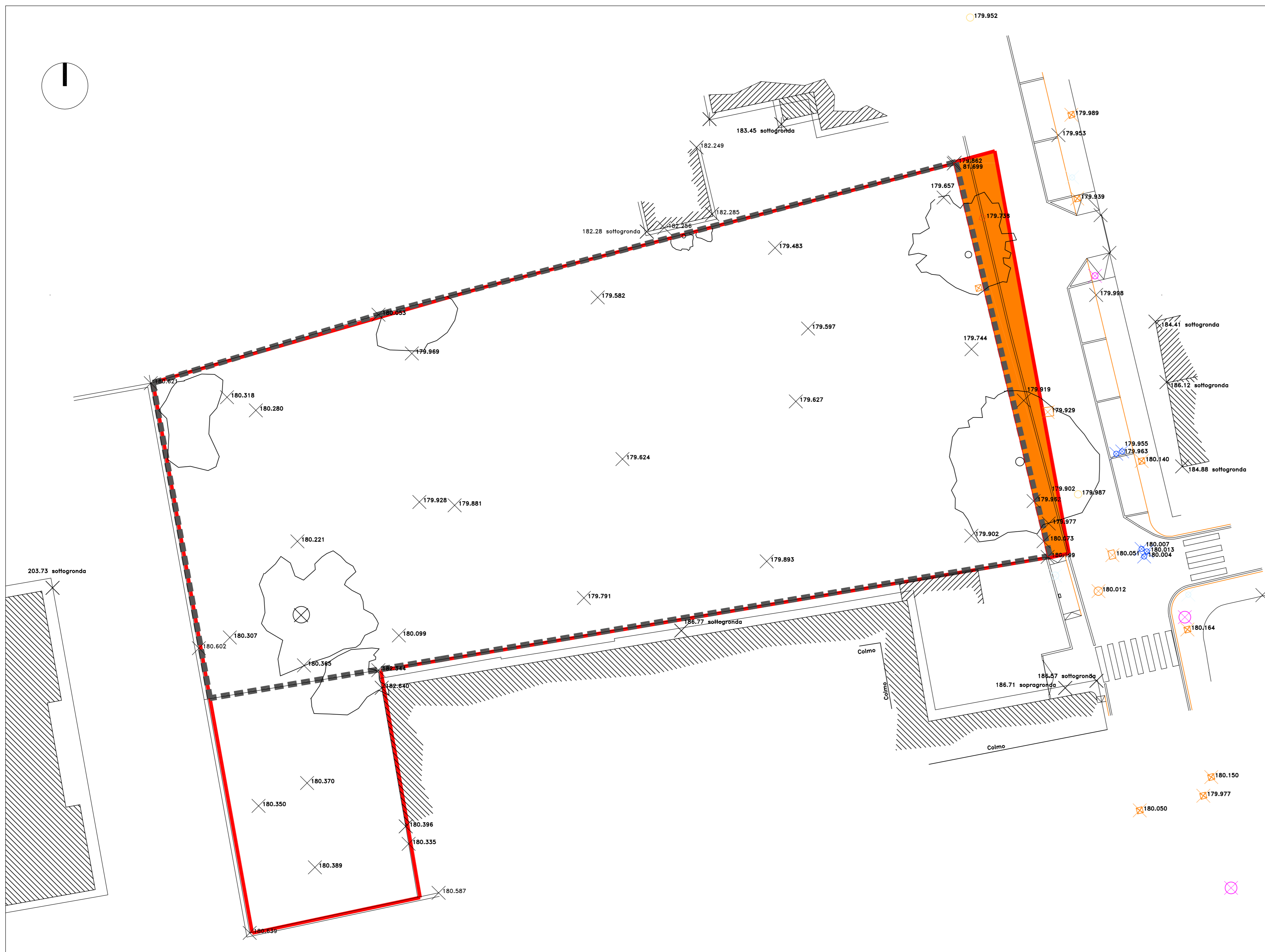
RILEVO PLANALTIMETRICO DELLE AREE D'INTERVENTO. SCALA 1:200