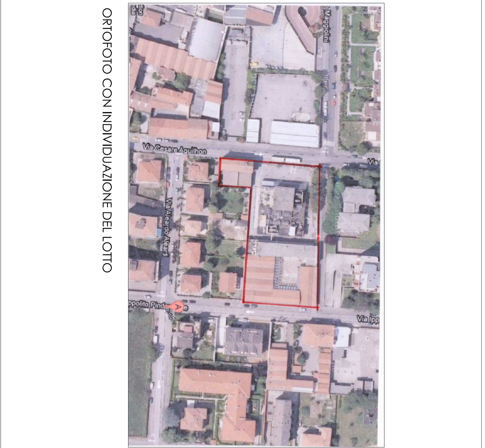
ORTOFOTO CON INDIVIDUAZIONE DEL LOTTO