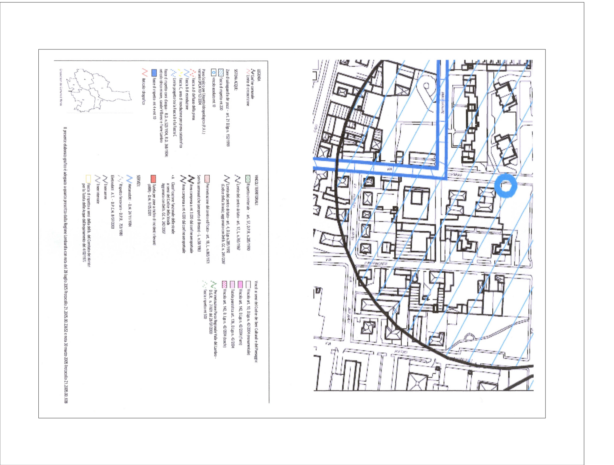
PGI VIGENTE - DOCUMENTO DI PIANO Tavola 1: vincoli in otto sul territorio