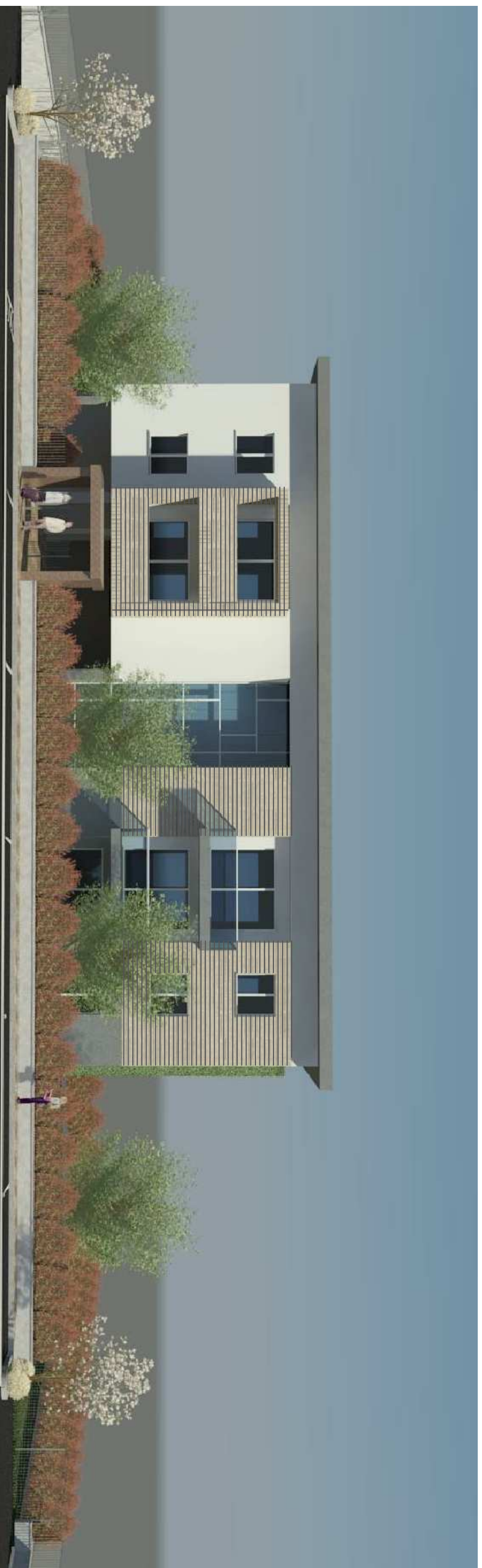
VISTA DA VIA CLEMENTI