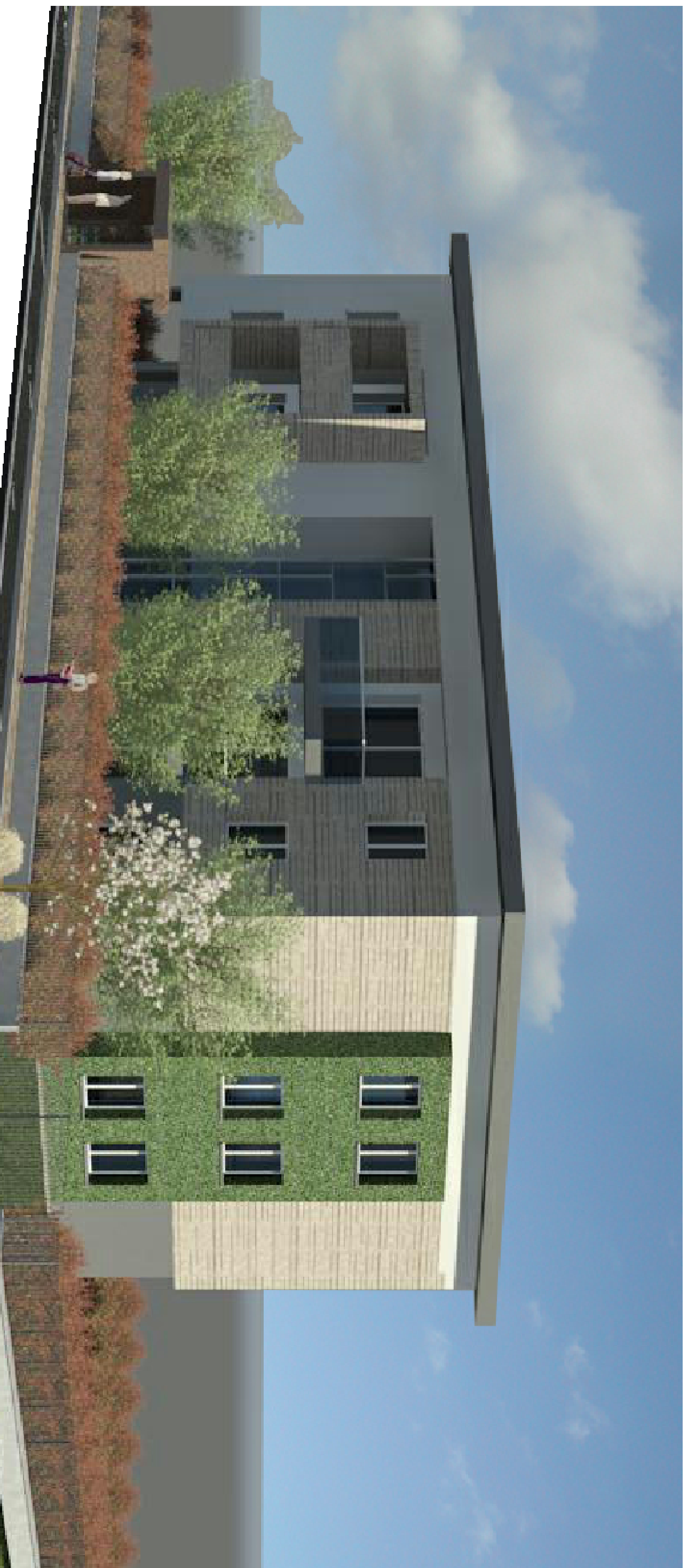
VISTA DA VIA CLEMENTI