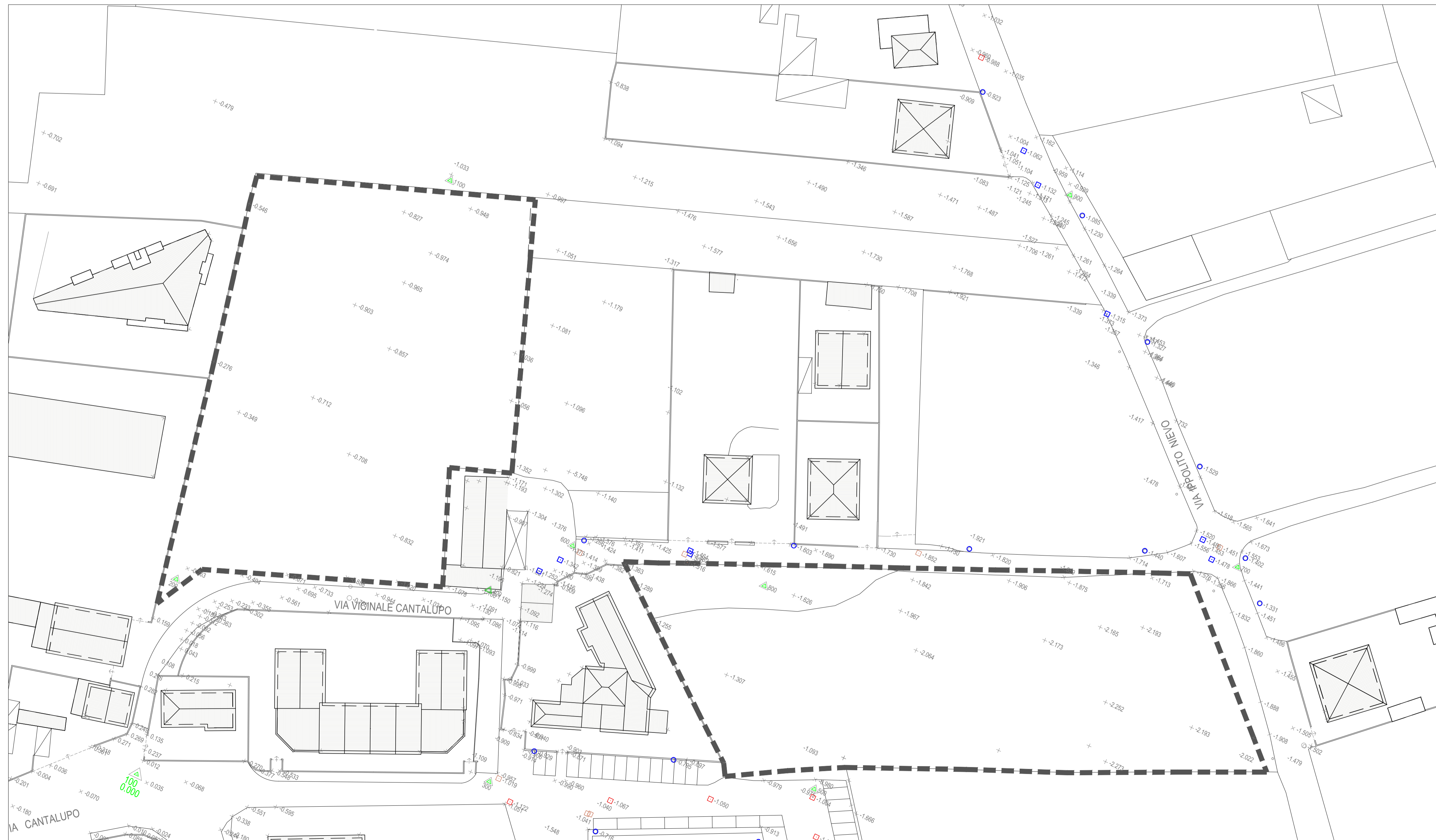
RILEVO PLANIALTIMETRICO DELLE AREE D'INTERVENTO