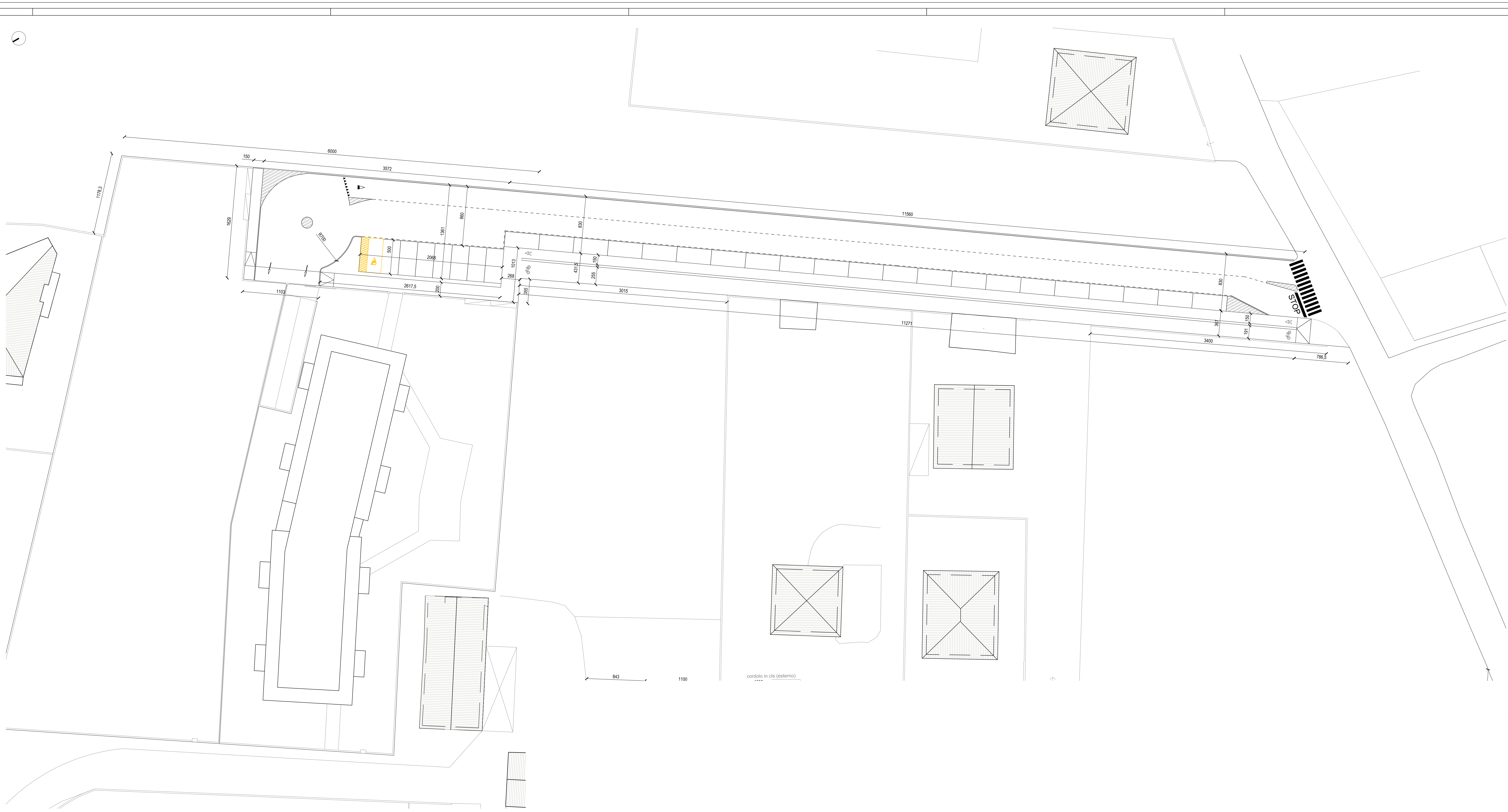
PLANIMETRIA STATO DI FATTO