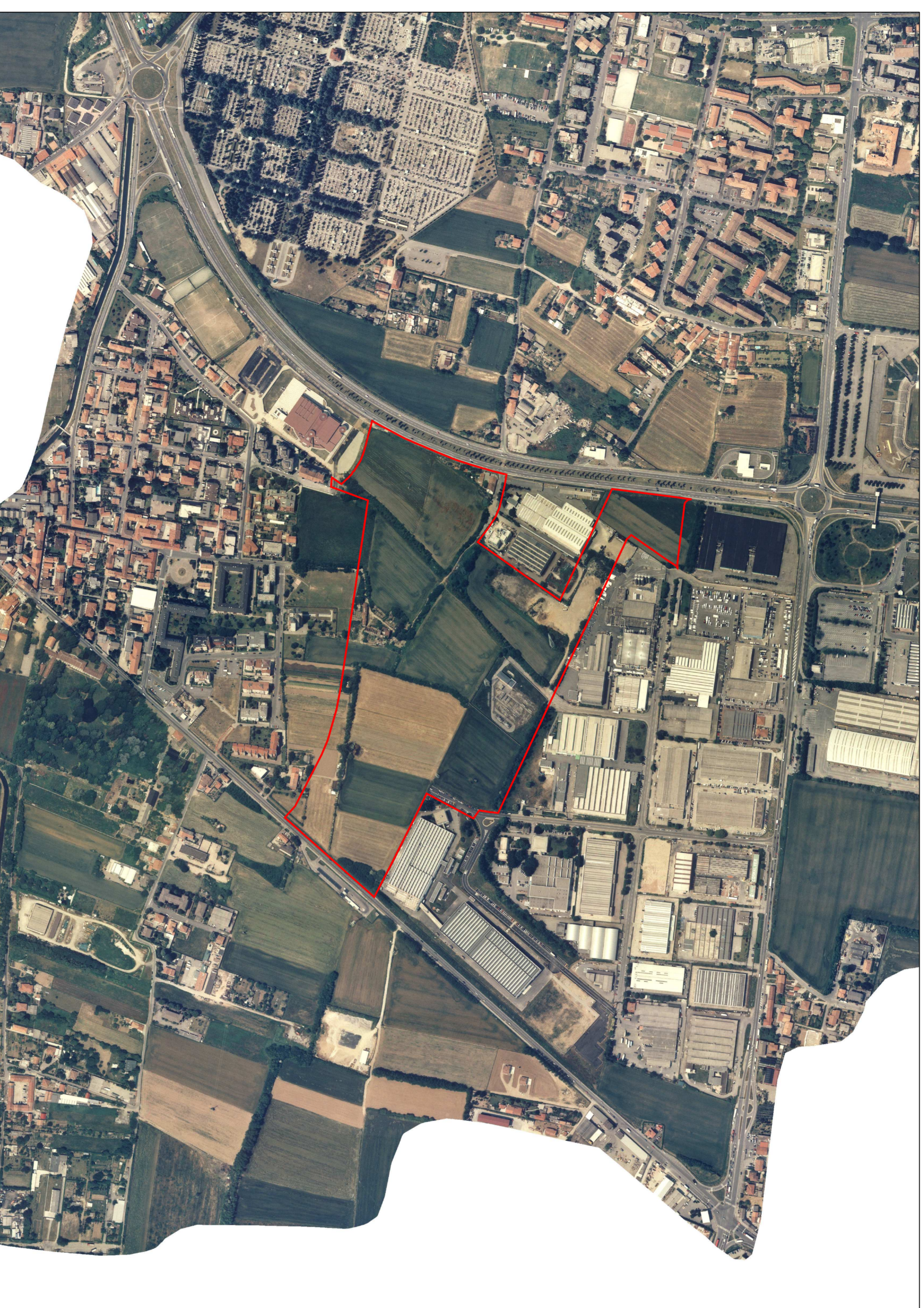
Foto aerea anno 2004