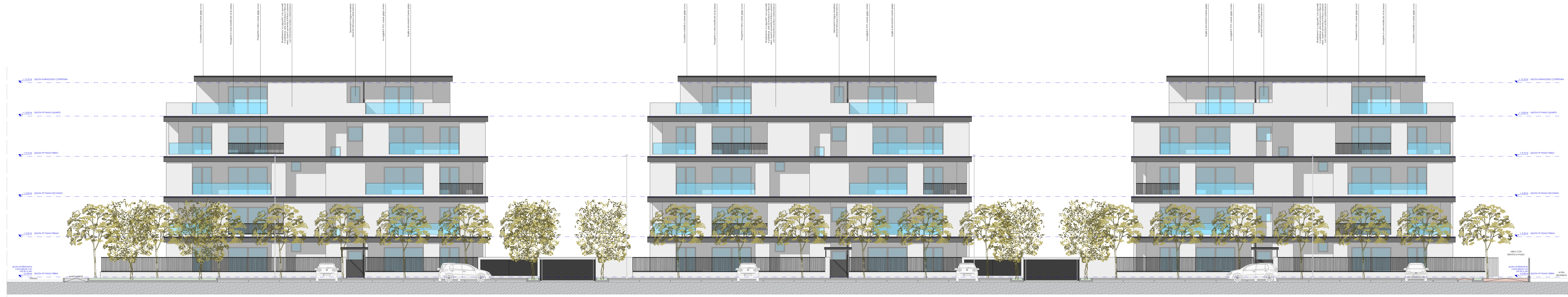
Edifici A - B - C Prospetto Sud