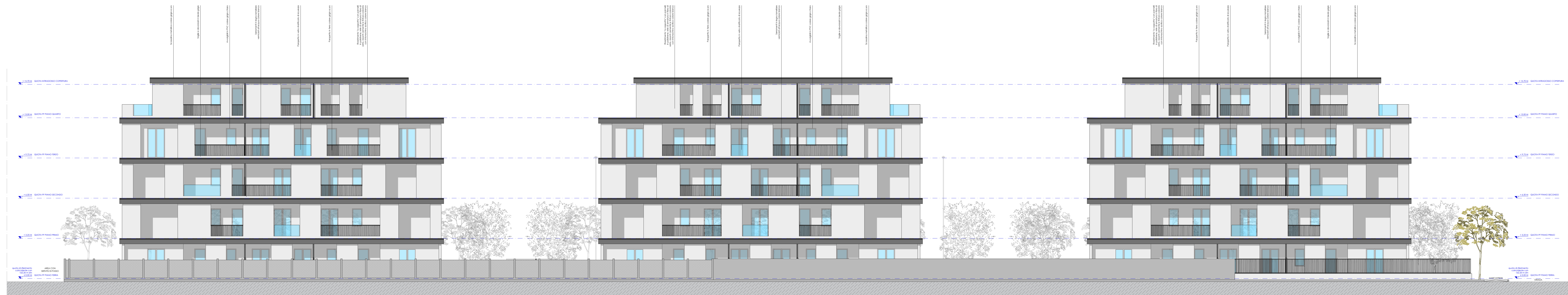
Edifici A - B - C Prospetto Nord