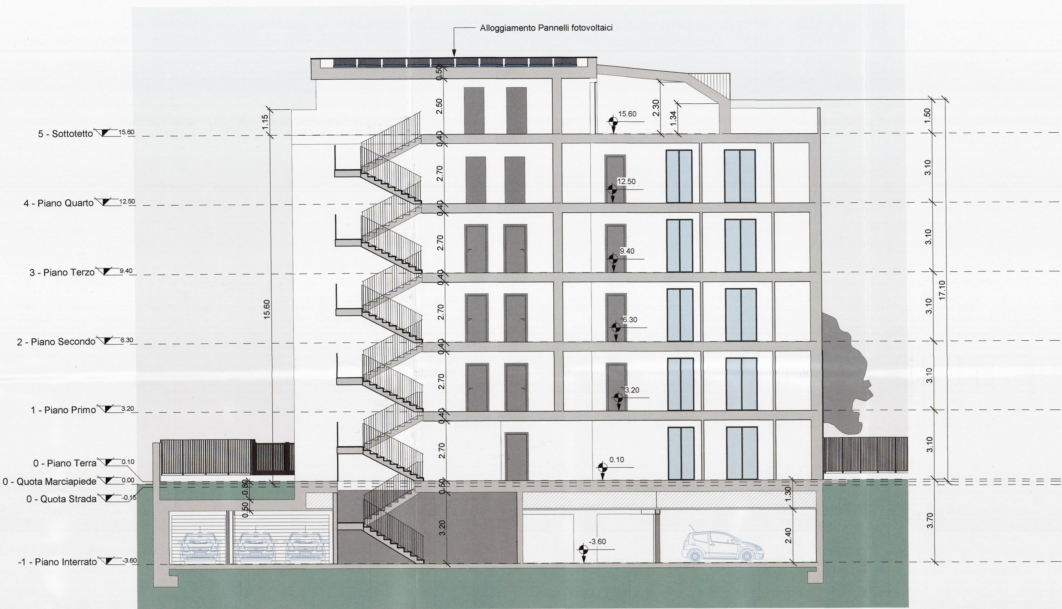
SEZIONE LONGITUDINALE A - A'