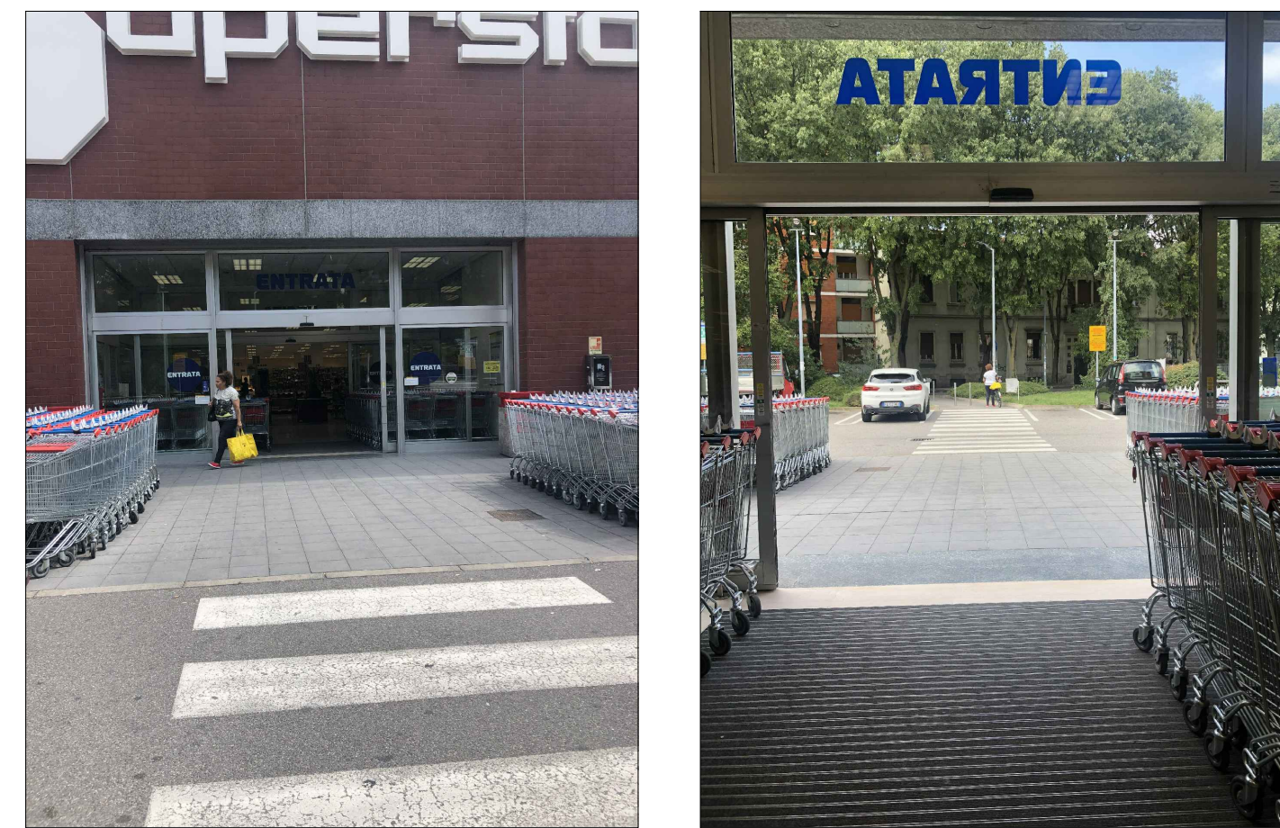
Ripresa fotografica 1: Accesso alla struttura di vendita

Il progetto è conforme alla L.R. n. 6/89, L. n. 13/89, D.M. 236/89 Tutti i locali con permanenza di persone hanno integrazione di illuminazione artificiale a norma del D.P.R. 303/56 e s.m.l. Tutti i locali sono provvisti di impianto di condizionamento dell'aria ai sensi dell'art. 3.4.47 del R.L.I. I pavimenti dei locali sono realizzati in materiale resistente, antiscivolo e con superficie impermeabile di facile pulizia Le pareti dei locali dei bagni e degli antibagni sono rivestite con materiale impermeabile e facilmente lavabile per un'altezza di almeno cm 220