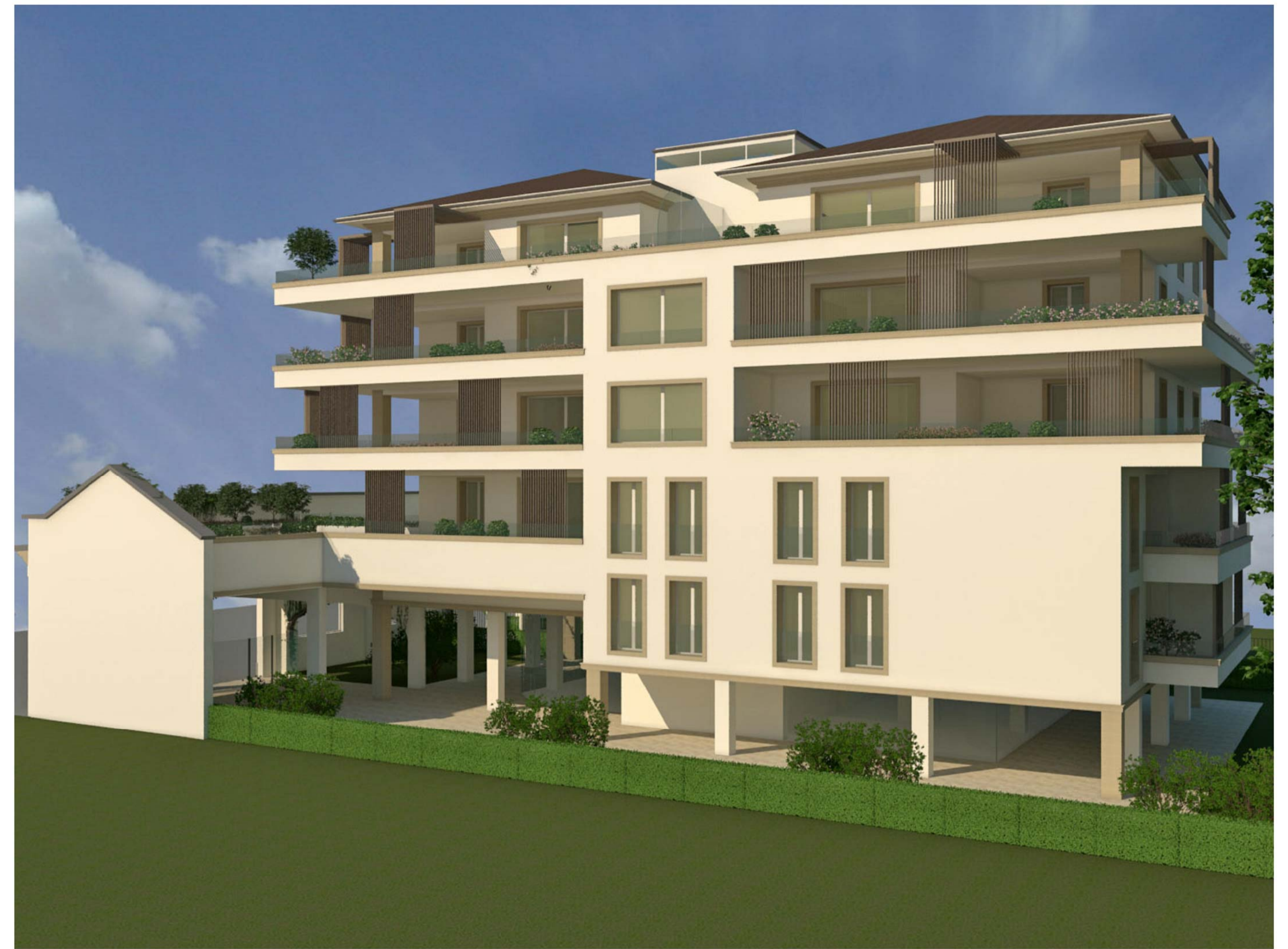
Vista 3D 5