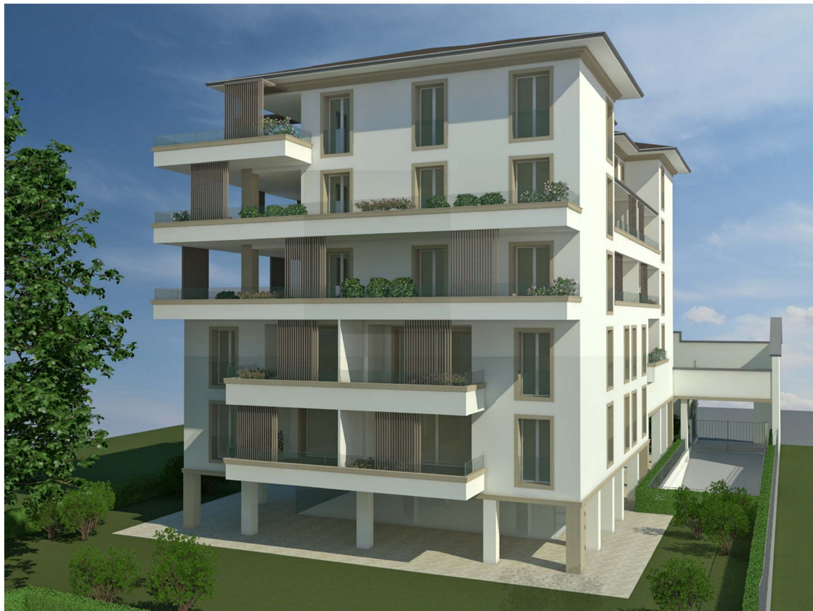
Vista 3D 6