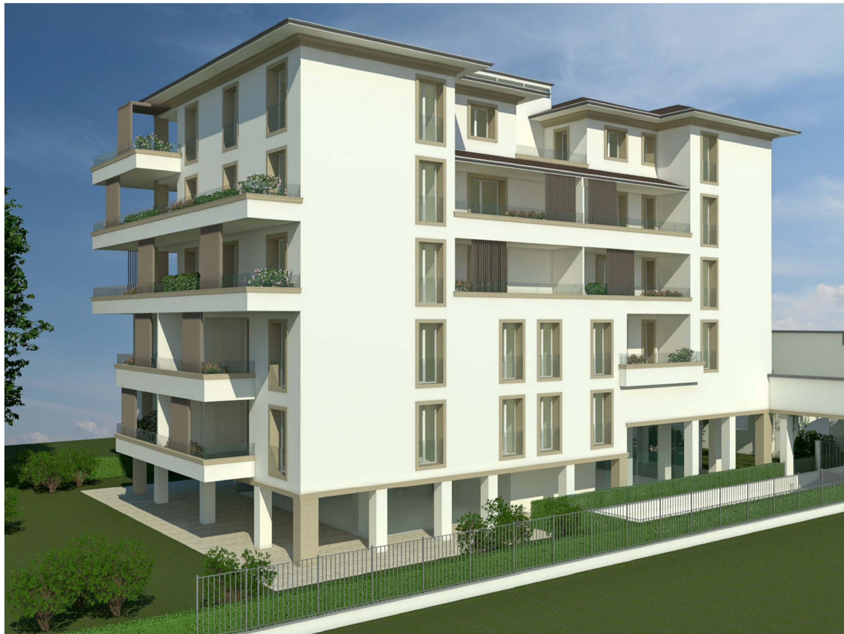
Vista 3D 4