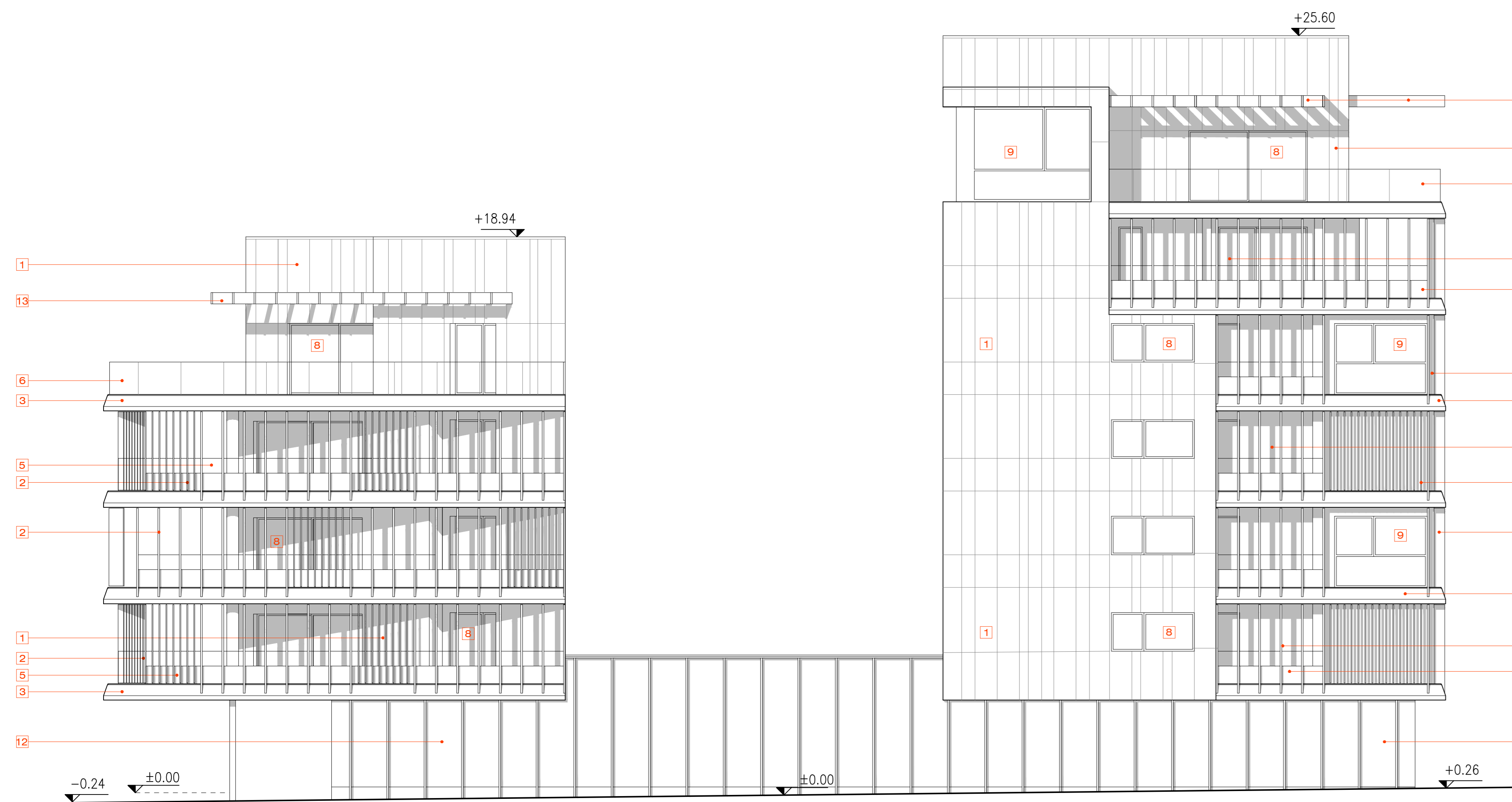
PROSPETTO VIA PADRE REGINALDO GIULIANI