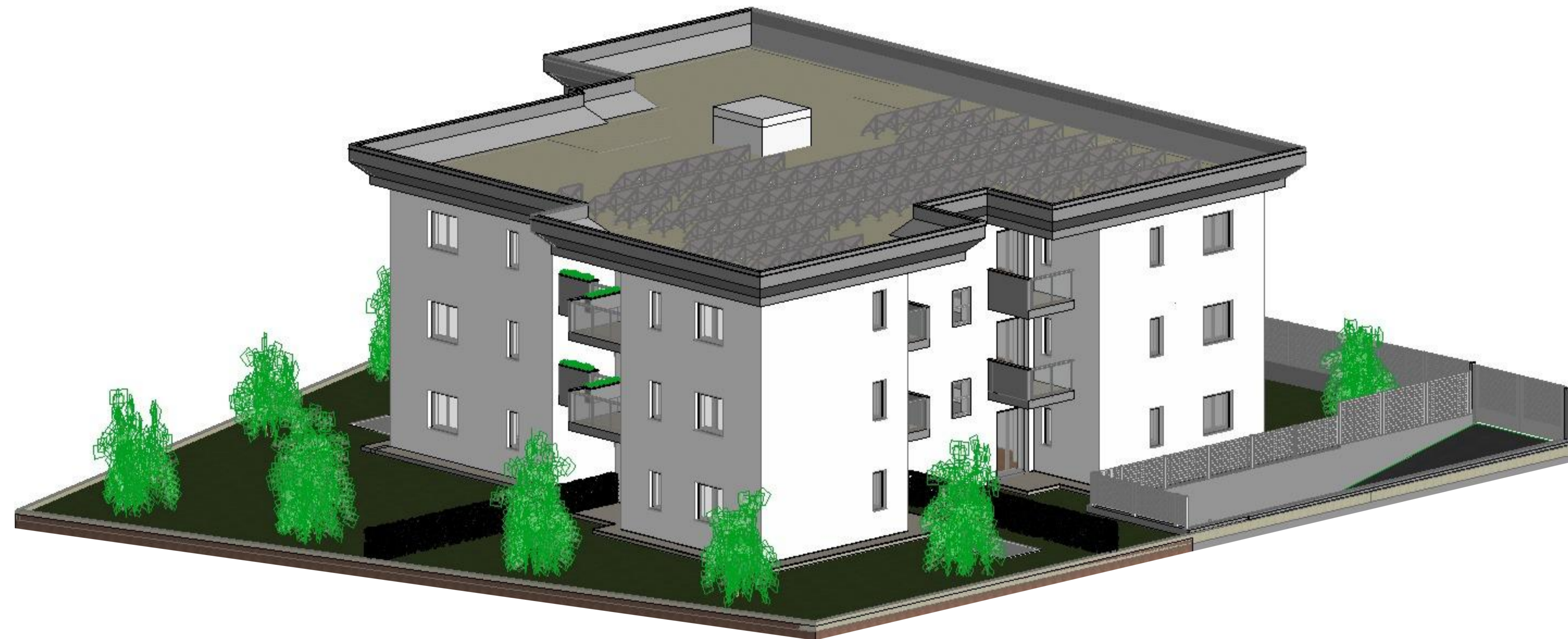
Assonometria EST - NORD