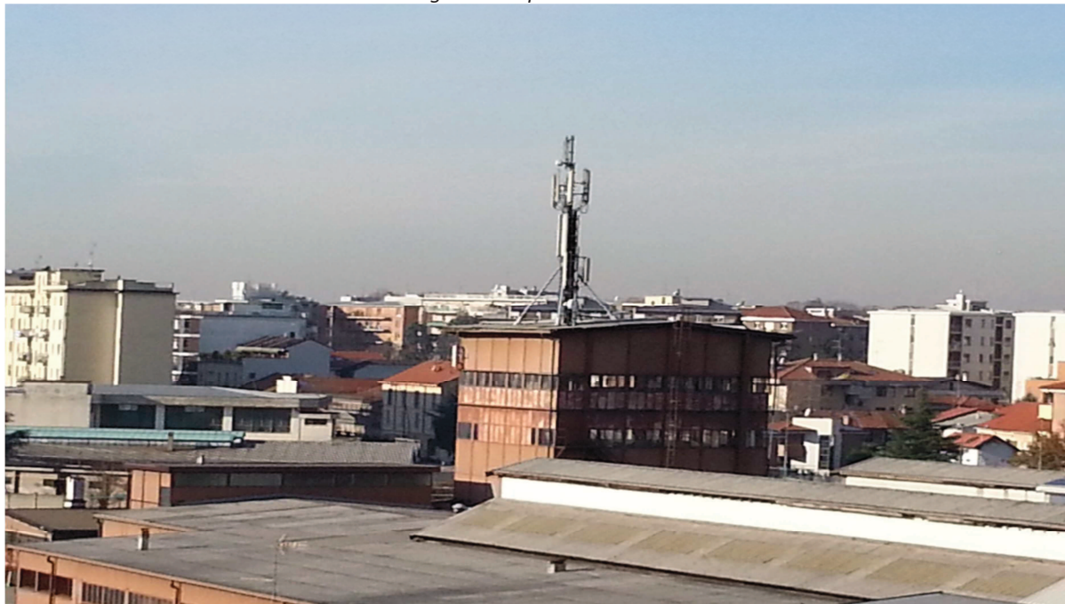
Figura 1: Impianti monitorati

Le misurazioni di campo elettromagnetico a radiofrequenza sono state eseguite al fine di stabilire se il campo elettromagnetico, generato dagli impianti radio base posizionati in Via Prampolini, 7 (figura 1) sia conforme ai valori di attenzione definiti dal D.P.C.M. 08.07.03 per aree abitative con permanenza non inferiore alle quattro ore giornaliere (tabella 2 all. B art. 3 comma 2: valore di attenzione pari a 6 V/m).