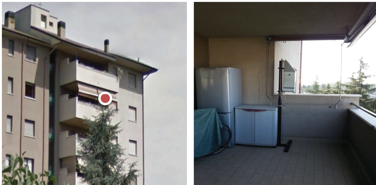
Figura 4: Rilievi in Continuo con Centralina PMM

Periodo di monitoraggio: dal 03.12.2013 (~11:30) al 16.12.2013 (~ 15:00) Punto di misura – Terrazzo quarto piano Via Bosisio, 3 – Monza (MB)