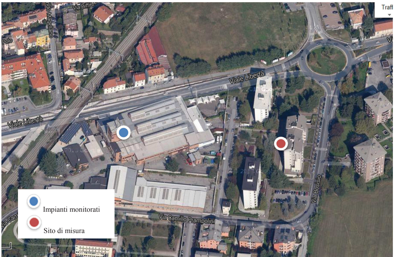
Figura 2: localizzazione del sito di misura e degli impianti radiobase considerati